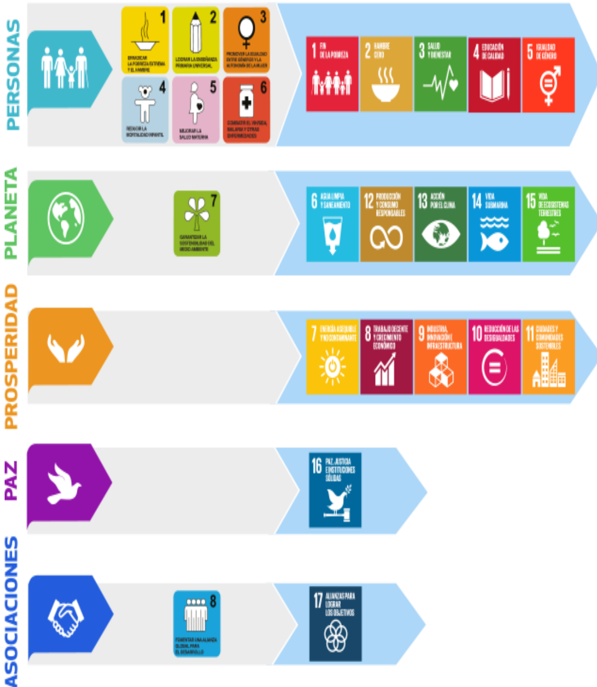
GRÁFICO 3: CLASIFICACIÓN DE LOS OBJETIVOS DE DESARROLLO SOSTENIBLE Y LOS OBJETIVOS DE MILENIO EN REFERENCIA A LAS 5P.