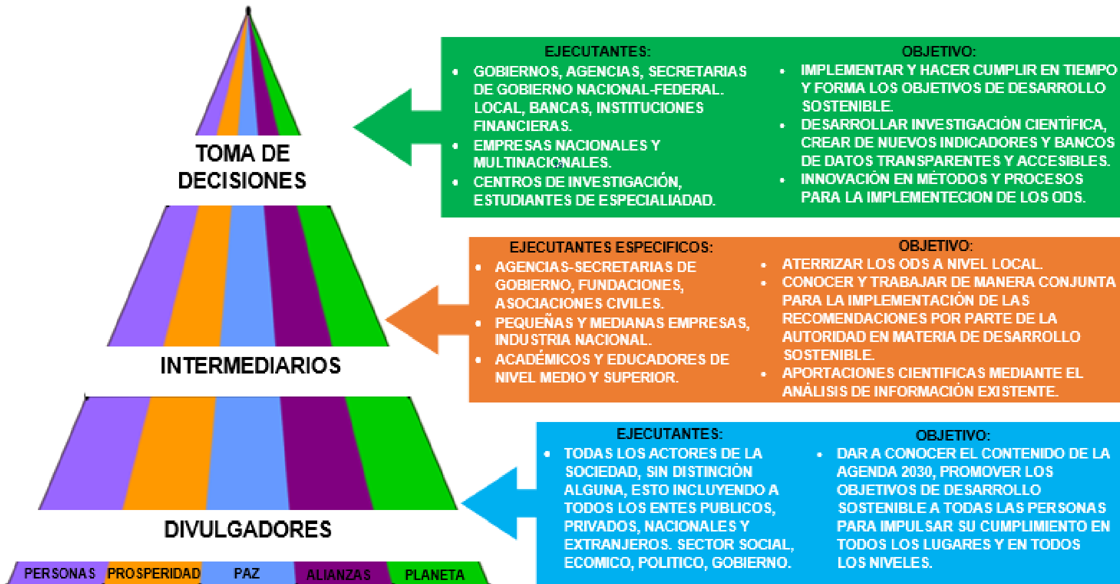
GRÁFICO 5: PIRÁMIDE DE EJECUCIÓN POR RESPONSABILIDADES PARA EL CUMPLIMIENTO DE LA AGENDA DE DESARROLLO SOSTENIBLE.