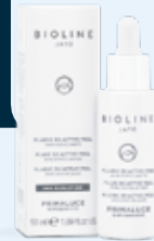
FLUID 50 ACTIVE PEEL AHA EXFOLIANTE