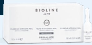
FLUID 40 INTENSIVE PEEL AHA ILUMINANTE