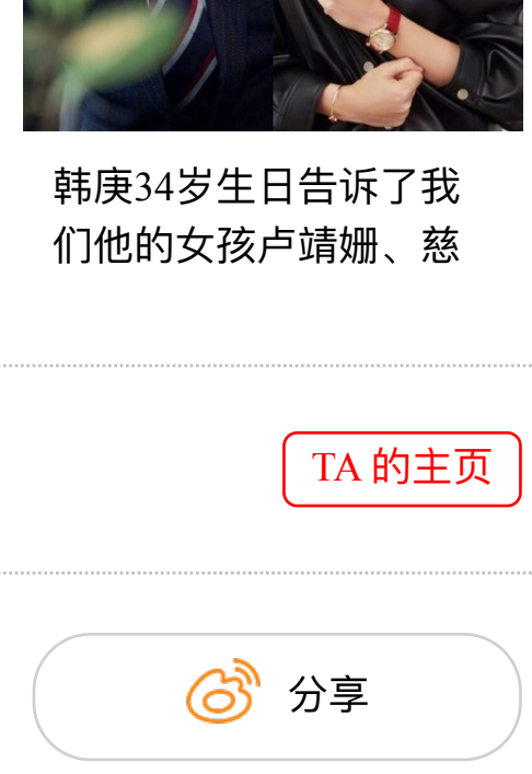
Flying Solo在Pier 59 Studio的展示 NYFW