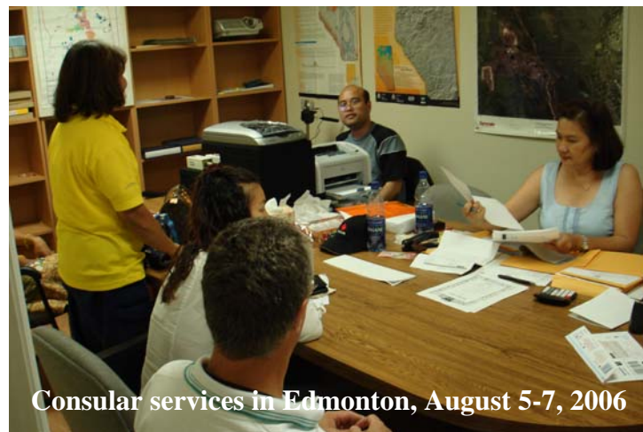
Consular services in Edmonton, August 5-7, 2006