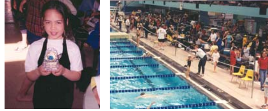
Stettler Pentathlon May 15, 2004