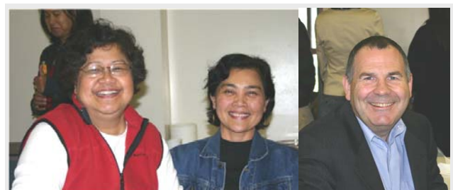
Ngamta (Eed) Winner

การประชุมในปีนี้ได้จัดให้มีขึ้น ณ ศาลาประชาคม มิลเบิร์นเหนือ มีผู้ร่วมงานราว 40 คน ในจำนวนนี้