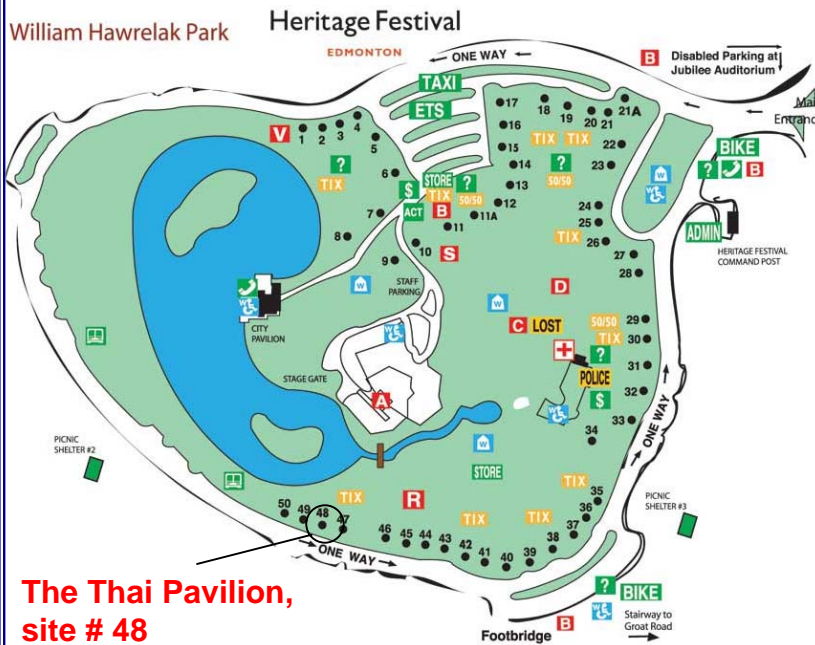
The Thai Pavilion, site # 48

For more information, please contact Alberta Thai Association at 908-1282 or Royal Thai Consulate General in Vancouver at (604) 687-1143