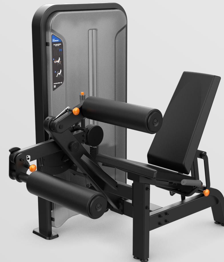
SEATED LEG CURL