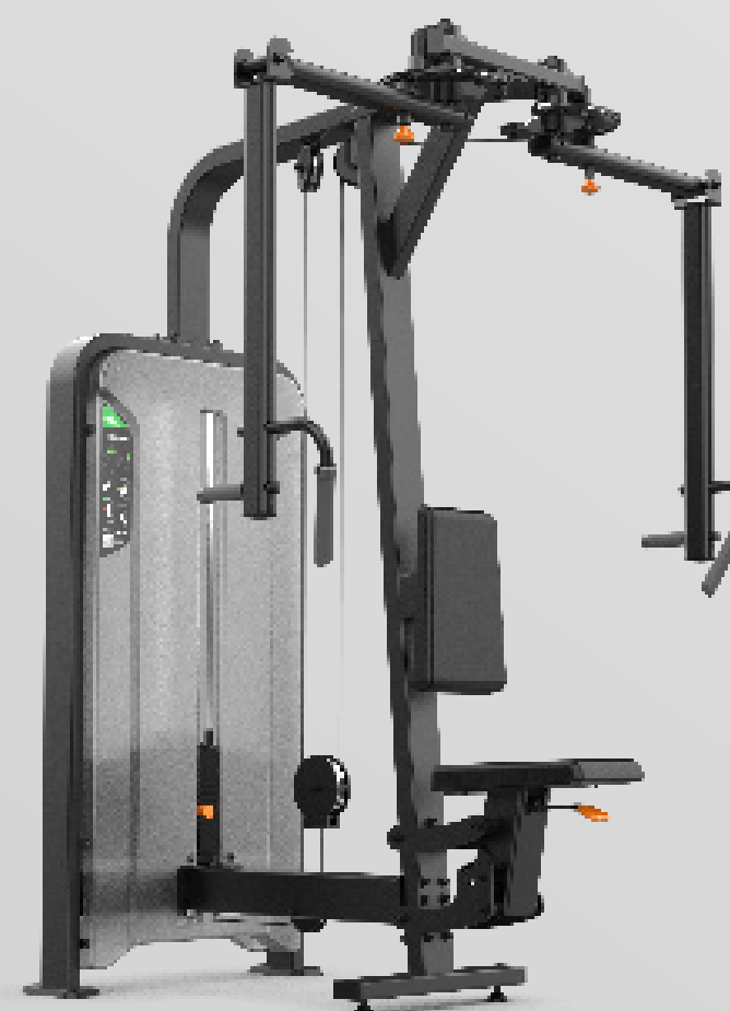
PEC FLY / REAR DELTOID