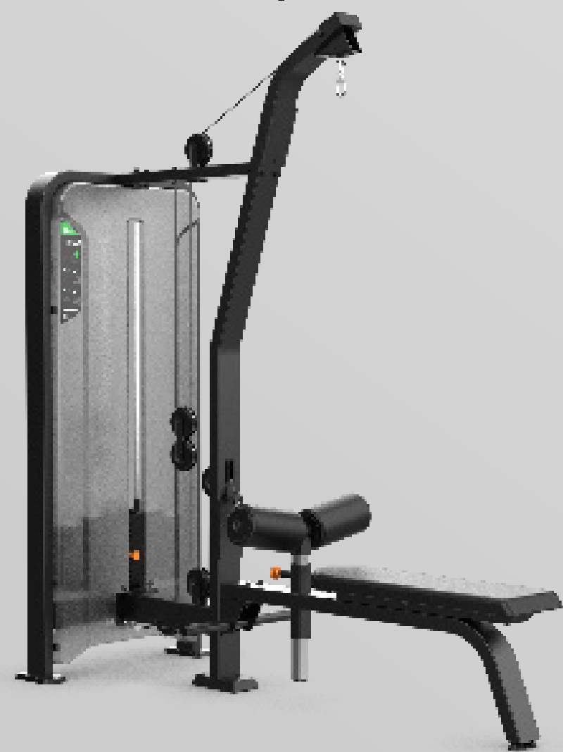
PULLDOWN CABLE / LOW ROW