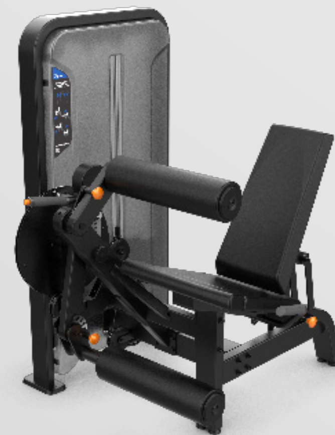
LEG EXTENSION / SEATED LEG CURL