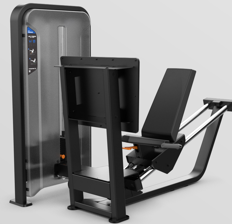
SEATED LEG PRESS