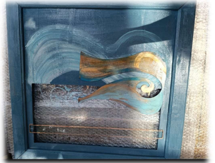
Görsel Grubu 5: Bodrum Suum Otel için hazırlanmış olan, tablolardan örnekler. Paletlerden yapılmış olan çerçevelere metal levha atık malzemelerinden çeşitli kesimlerle birlikte akrilik boya çalışması.