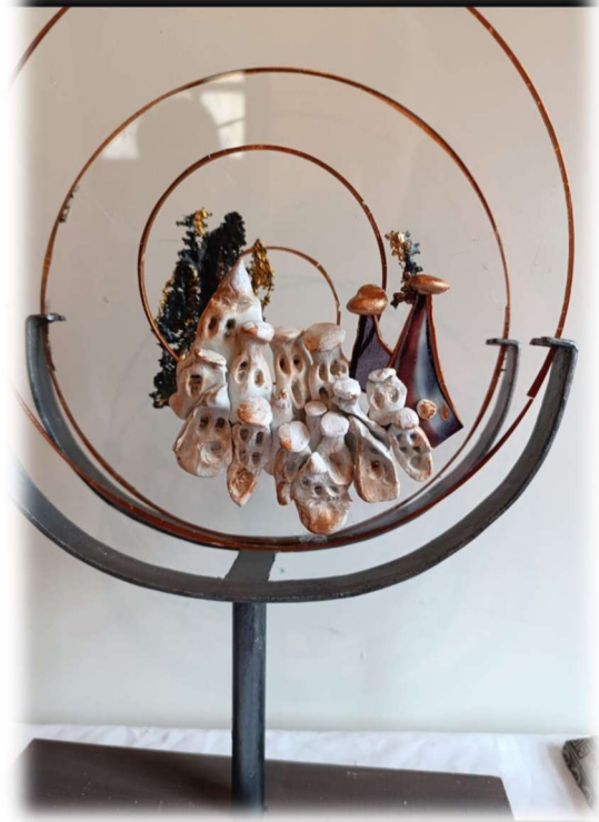
Görsel Grubu 4: Yukarıda görsellerde yer alan eserler atık cam parçaları, seramik, döküm çapakları ve strafordan çalışılmıştır. Reklam firmalarının atıklarından olan pleksi glass'dan üretilmiş olan eserlerimiz Ticaret Bakanlığı, Aile ve Sosyal Politikalar Bakanlığı'nın siparişleri olarak sıfır atık konseptli üretilmiştir.