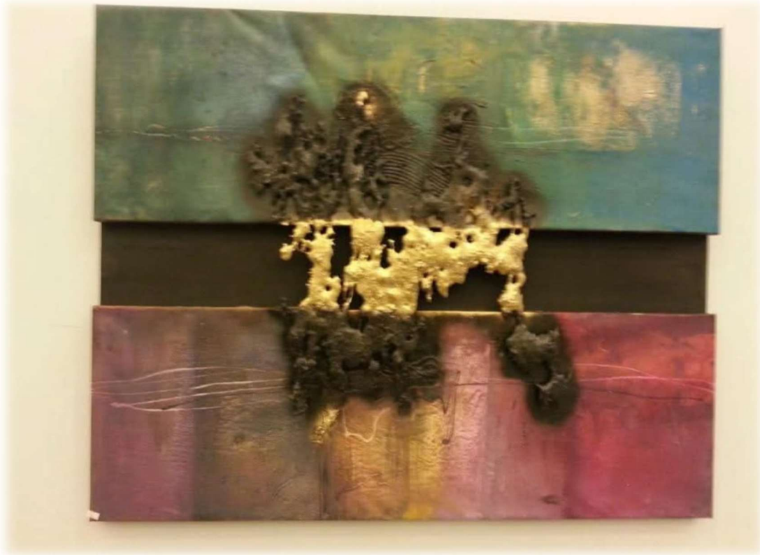
Görsel Grubu 2: Yukarıda örnek görselleri yer alan döküm çapakları ile tablo ve heykel çalışmaları, Aktaş Döküm ve Körfez Döküm firmaları tarafından satın alınmıştır. (Naciye Özdemir, Kurucu Başkan)