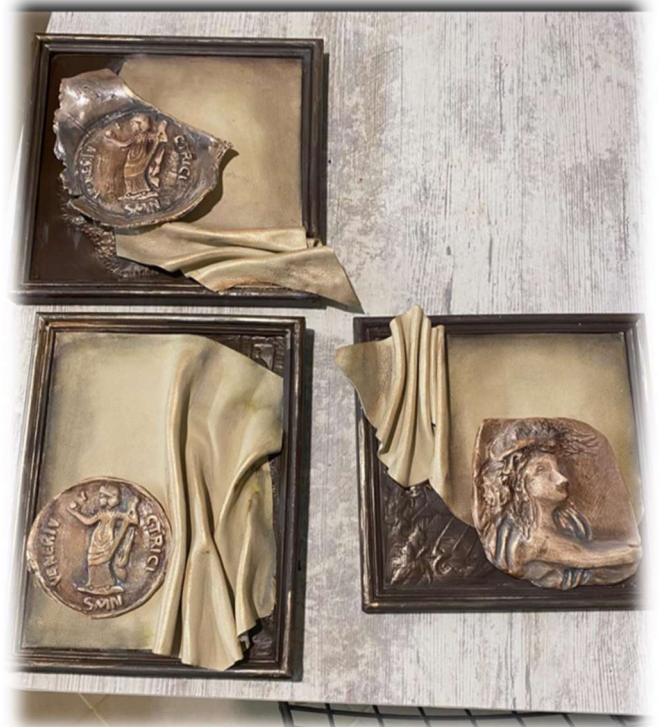
Görsel Grubu 3: Yukarıdaki örnek görsellerde yer alan tablolar, atık deri materyaller ve seramikten çalışılmıştır. (Nurhan Gündoğdu, Kooperatif Ortağı)