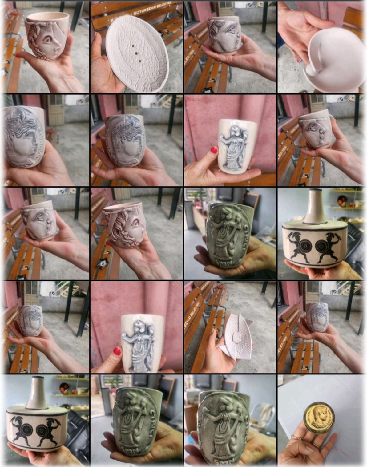
Görsel Grubu 6: Nikomedia Kazıları Vakfı için çalışılan ürünlerden örnekler.