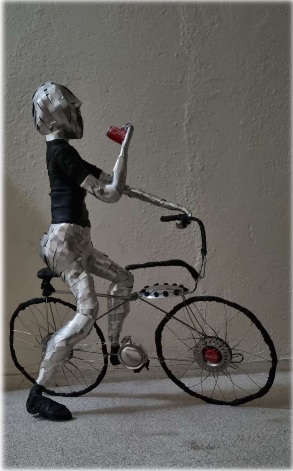
Görsel 1: Kutu kola ambalajından üretilmiş, Coca-Cola Bölge Bayisi için çalışılmıştır. (Saadet Uğuz, Kurucu Ortak)