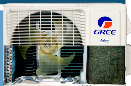
base avec élément chauffant

GREE équipe l'unité extérieure de la LOMO 23 d'une base avec élément chauffant qui empêche le gel de condensat et assure la pleine efficacité de l'appareil et une puissance de chauffage maximale.