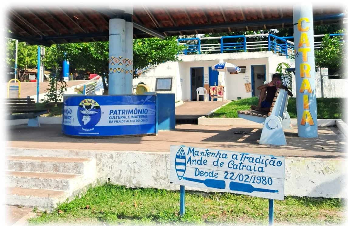
Figura 5 – Terminal de embarque e apoio da Associação de Catraieiros. Centro de Alter do Chão

Vale ressaltar que eles enfrentam dificuldades financeiras que não se restringem somente à renda individual, pois elas também afetam os investimentos na sede da associação, nas condições de trabalho e no apoio aos próprios associados. Assim como nos períodos de baixa temporada, quando a água do rio seca, eles ficam por mais de seis meses sem trabalho e buscam outros tipos de serviços como pedreiros, caseiros, garçons, entre outros, para manter as contas em dia e o sustento da família.