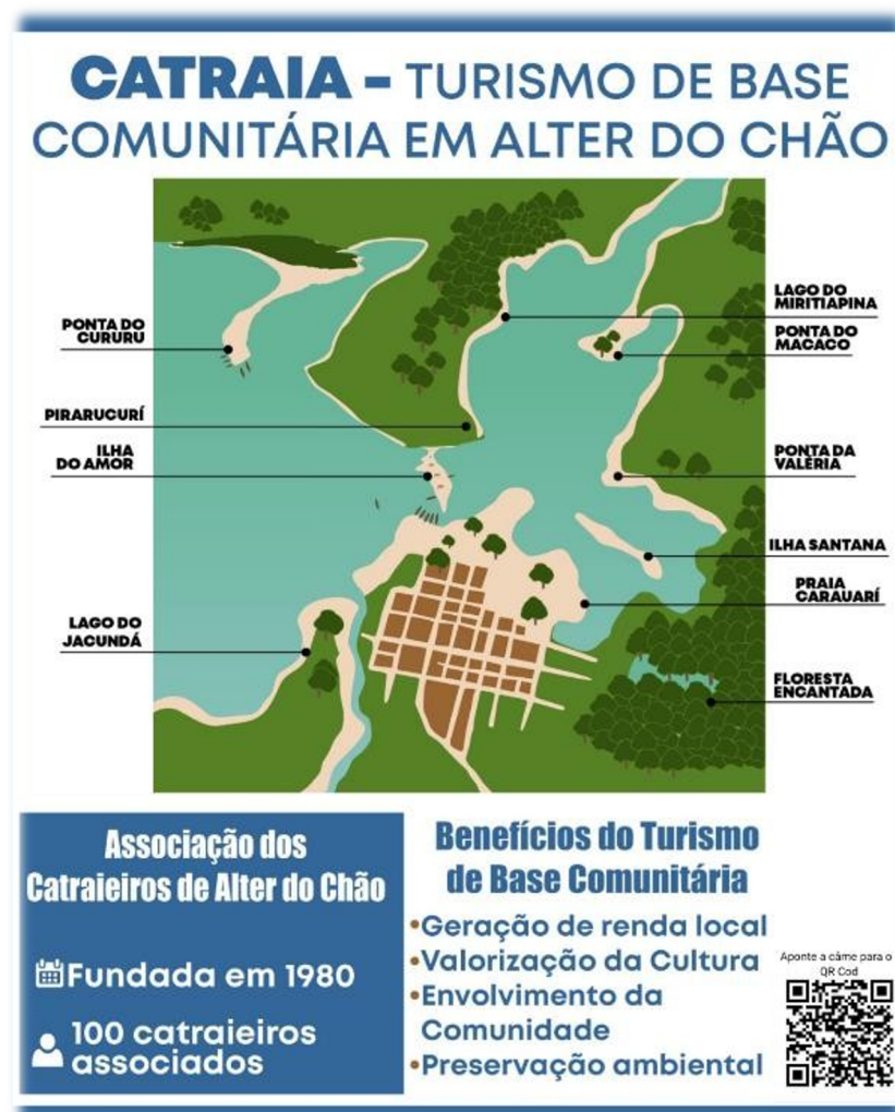
Figura 7 – Folder sobre a catraia com ilustração dos locais de passeio