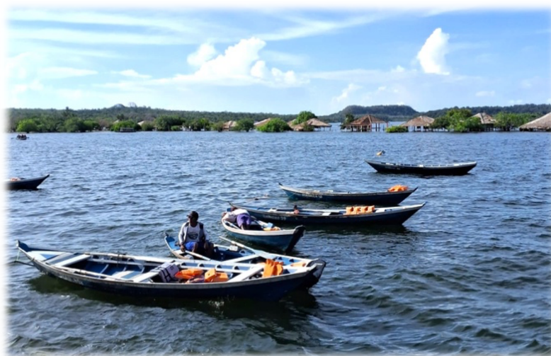
Figura 2 – Catraieiros aguardando para fazer a travessia da Orla para a Ilha do Amor. Lago Verde, Orla central de Alter do Chão

A Travessia para a Ilha do Amor, segundo o Sr. Antônio Cleydson, é o principal atrativo turístico de Alter do Chão. O trabalho realizado pelos catraieiros, que transportam pessoas de um lado para o outro da praia do Lago Verde, “remando” em pequenas embarcações chamadas catraias. Esse tipo de remo, também conhecido como “faias”, é produzido artesanalmente com madeira de árvores específicas, como Tapiripica , Marupá e Envira-preta .