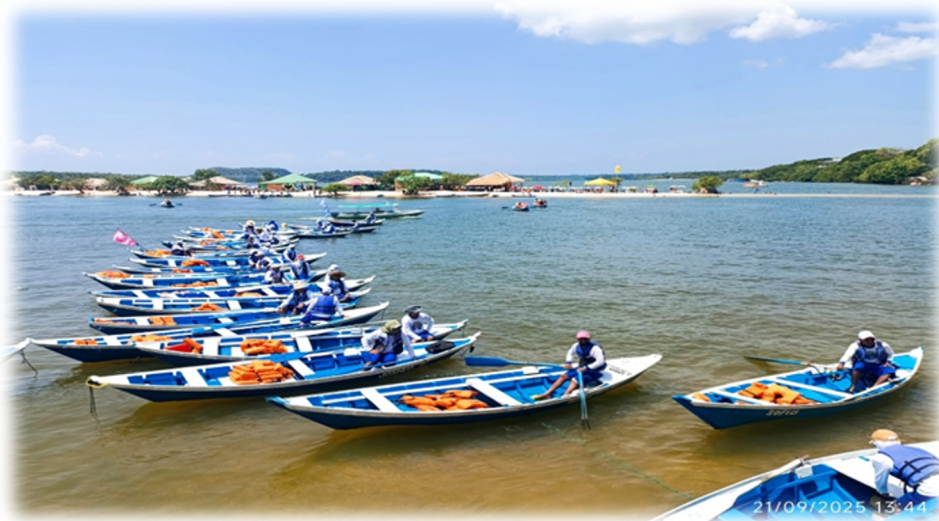
Figura 6 – Catraieiros devidamente uniformizados e organizados em fila única. Lago Verde, Orla central de Alter do Chão

No que diz respeito à conduta profissional, é expressamente proibido o uso de bebidas alcoólicas durante o horário de trabalho. Caso essas ou outras normas sejam descumpridas, tanto o associado quanto o contratado podem sofrer advertência ou suspensão, conforme regime interno da entidade. Além disso, o catraieiro deve estar devidamente uniformizado, obedecer ao critério de fila para embarque e desembarque, usar coletes e respeitar o total de lotação e o valor da travessia, conforme mostra a Figura 6 .