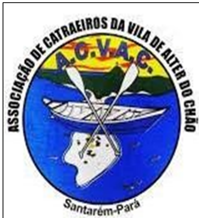
Figura 8 – Logomarca da Associação dos Catraieiros de Alter do Chão