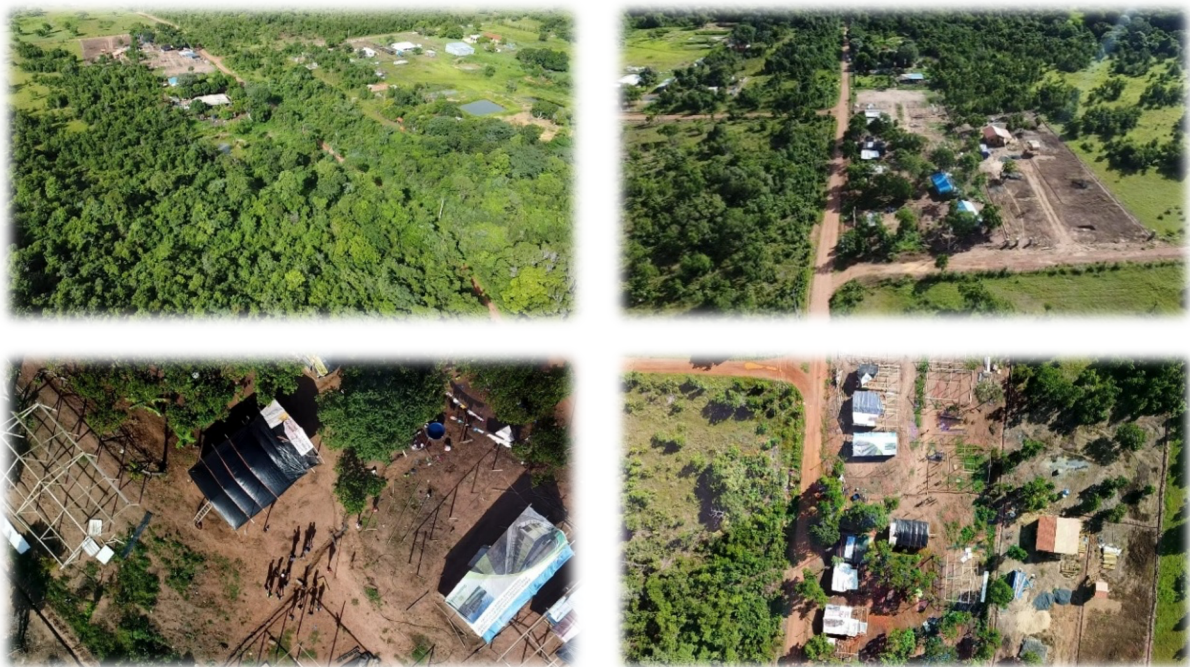
Figura 4 – Mosaico de vistas aéreas da Comunidade Nossa Senhora da Consolação.

Assim os Warao , depois de terem saído do São José, onde ficaram um ano, alugaram um sítio para ficar próximo e fazer as casas na área comunitária que parecia ser entregue antes do pleito político, mas foram palavras vazias. Assim, em novembro de 2024, foi adquirido pela arquidiocese de Cuiabá o local que serve de acampamento para a Comunidade de Nossa Senhora da Consolação . Ali foi contratado um profissional para a construção de banheiros públicos com foças sépticas para não contaminar o lençol freático uma vez que já estamos no pantanal e o rio Paciência desagua no Aricá dois quilômetros abaixo.