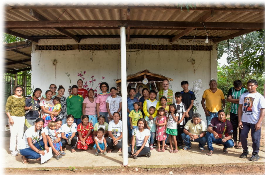
Figura 1 - Comunidade Warao do Recanto das Aves.