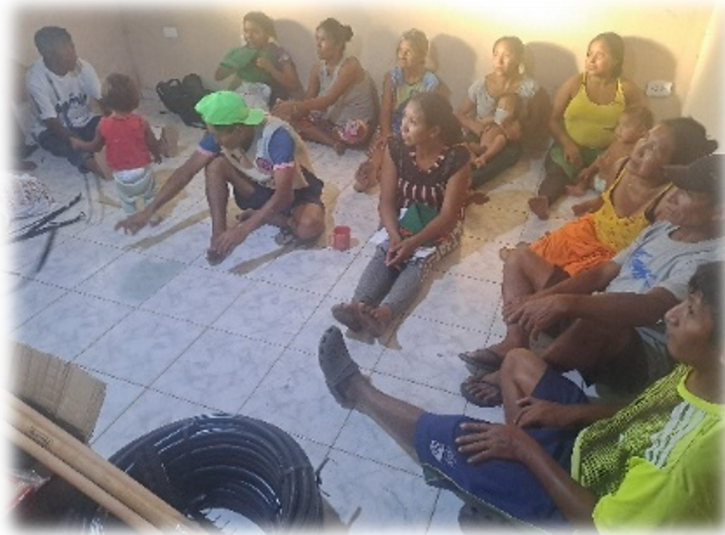
Figura 6 – Mosaico da sala comunitária para aula de Agroecologia; casas das 20 famílias feitas pelos Warao com palite (Novo Aricá).

metodologia usada é participativa e descolonizadora, importando sempre a cultura Warao , contudo, adaptando as atividades à realidade semiurbana na qual vivem no momento.