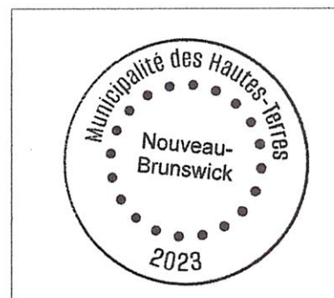
Sceau de la municipalité ici.