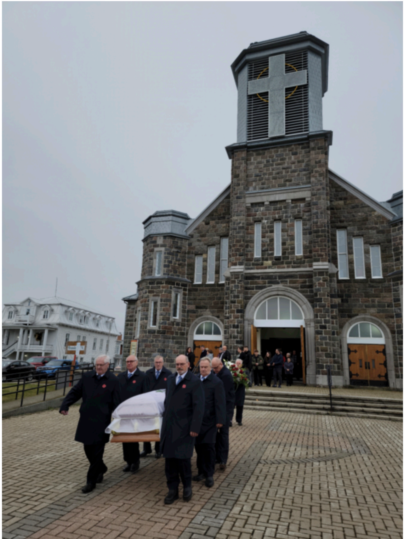
Les porteurs de la maison funéraire Léon Sirois et Fils transportant le cercueil à la sortie de l'église Saint-Jérôme.