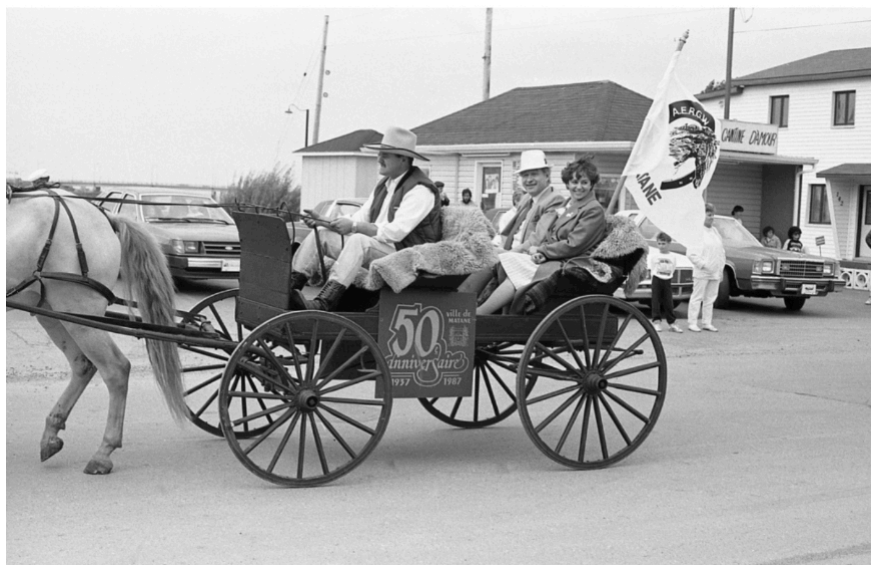
Au défilé soulignant le 50e anniversaire de la Ville de Matane sur l'avenue D'Amours en 1987.