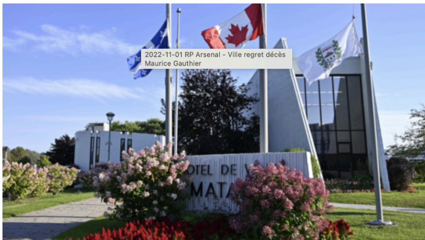
Les drapeaux de l'hôtel de ville en berne.

Afin d'honorer la mémoire de « ce grand homme de la politique municipale matanaise » qu'était l'ex-maire Maurice Gauthier, les drapeaux de l'hôtel de ville de Matane seront en berne jusqu'au jour de ses funérailles, le vendredi 11 novembre.