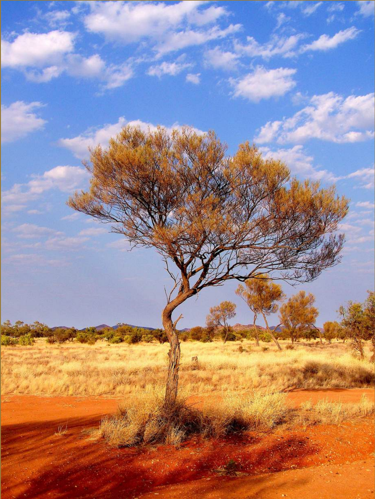
2008 Outback Australia Gemtree Harts Range