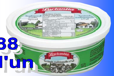
0567 LACTANTIA MARGARINE MOLLE 12 /850GR