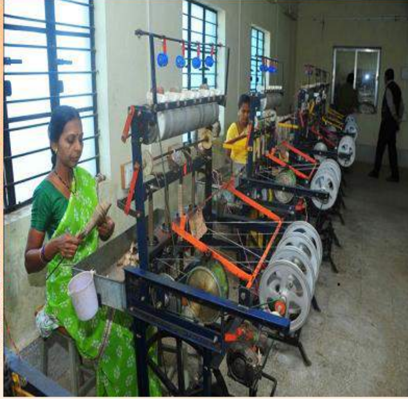
टस्पर रिलींग सेंटर येथे काम करणान्या महिला