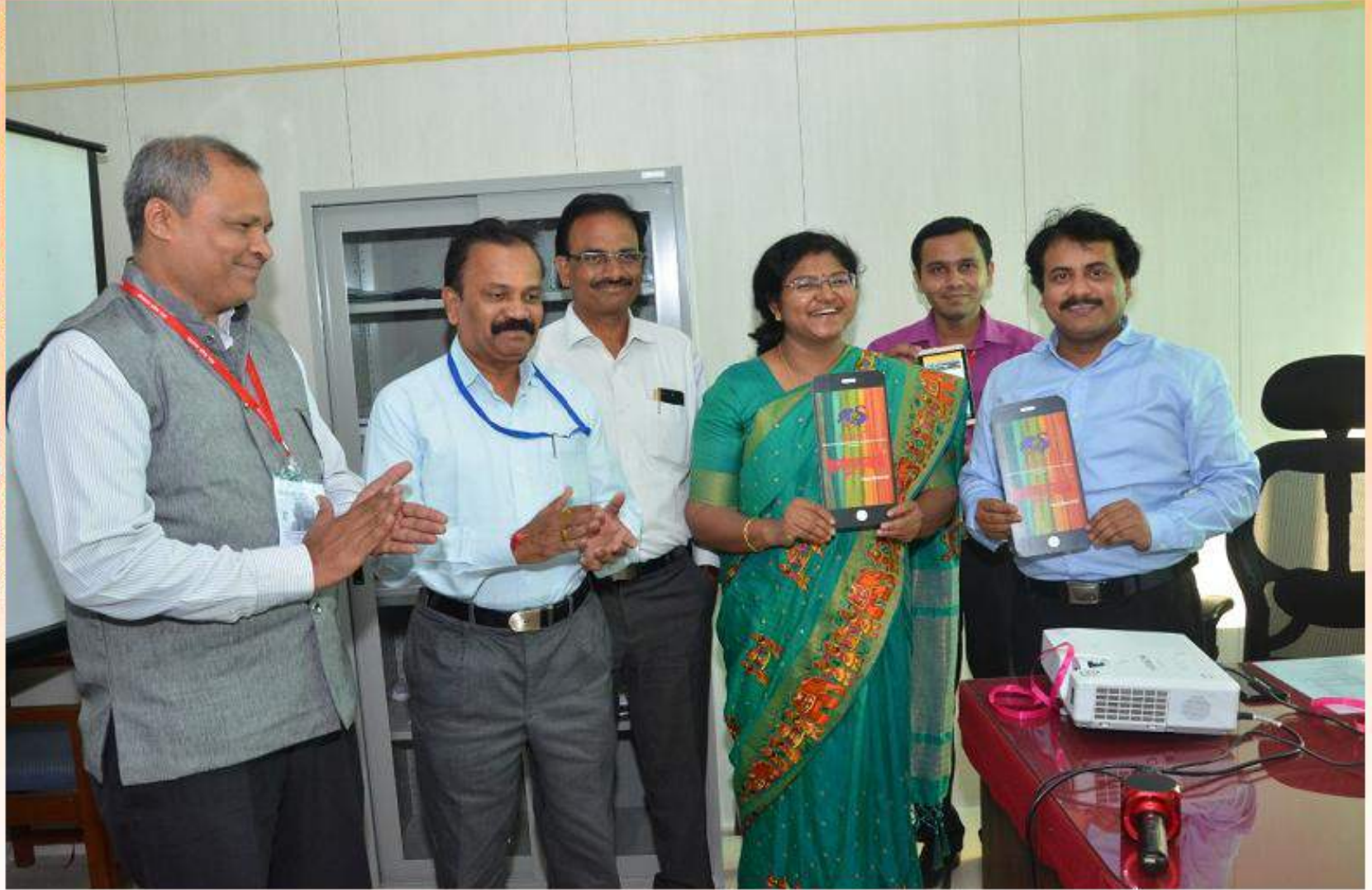
मोबाईल ॲप MH-Digiloom चे उद्घाटन