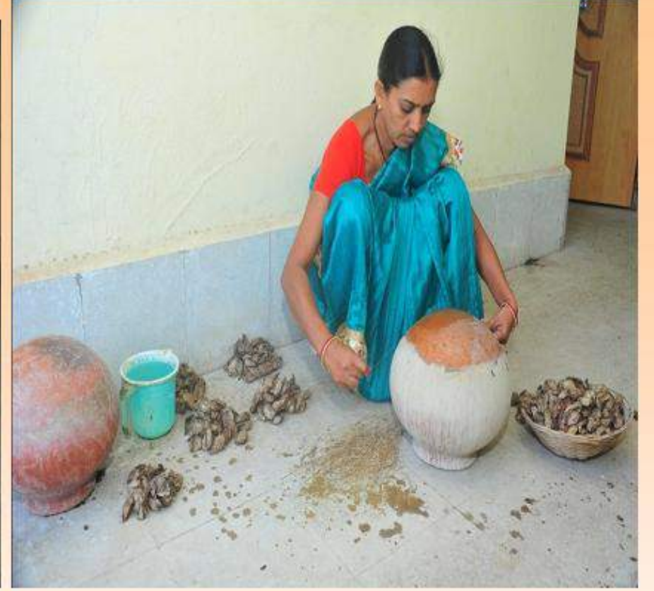
कूकून मधून सूत काढतांना महिला