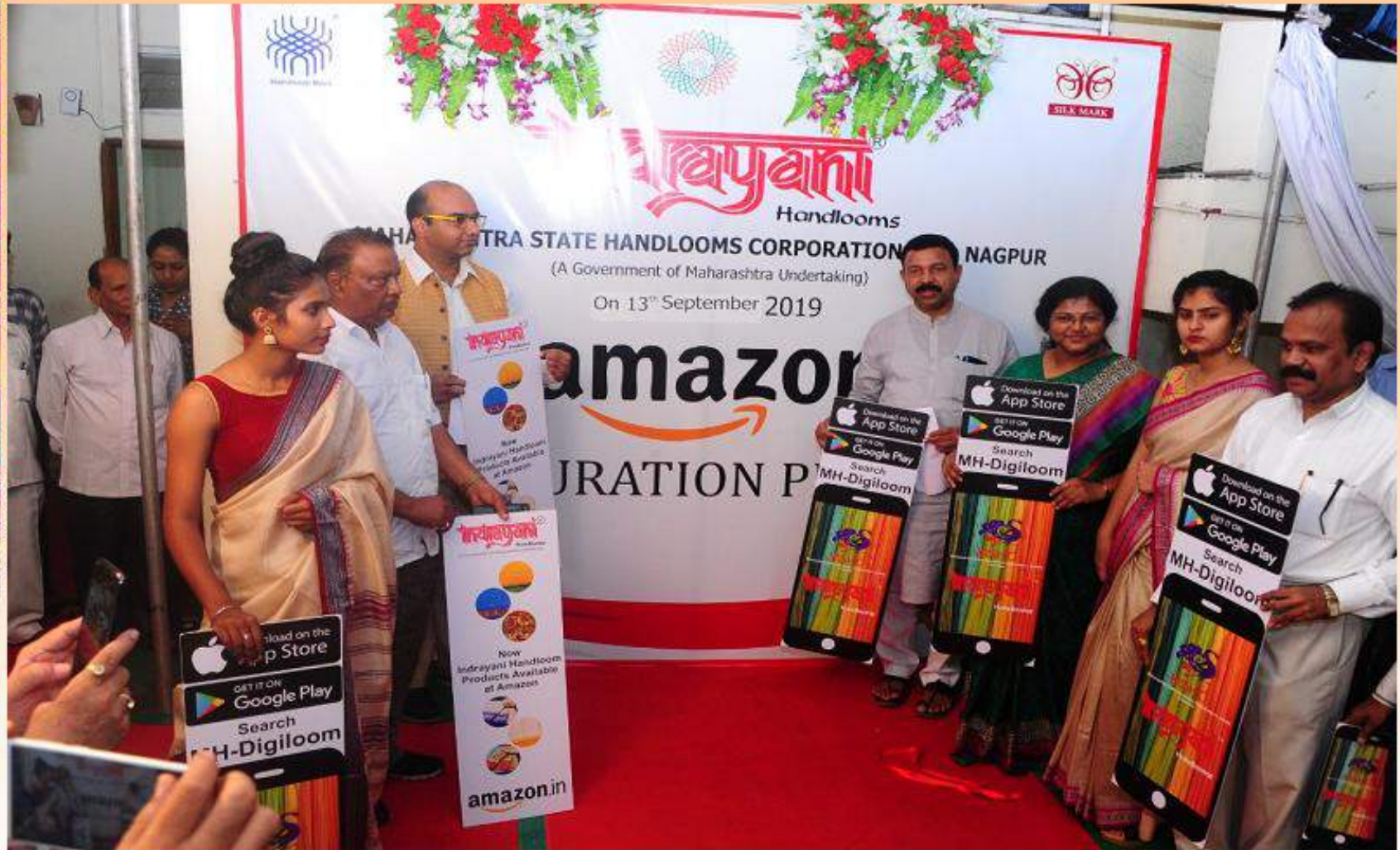
Amazon चे उद्घाटन