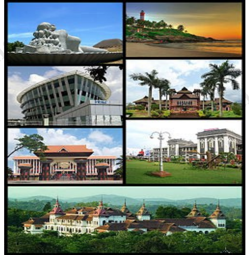
Clockwise from top right: Kovalam Beach , Napier Museum , Trivandrum Central , Kowdiar Palace , Niyamasabha Mandiram , Infosys Building , The Sculpture of Jalakanyaka Mermaid