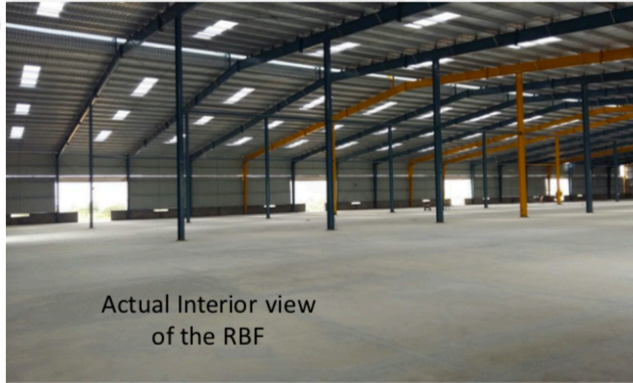
Actual Interior view of the RBF