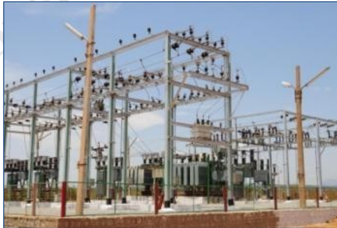
11 KV 分站