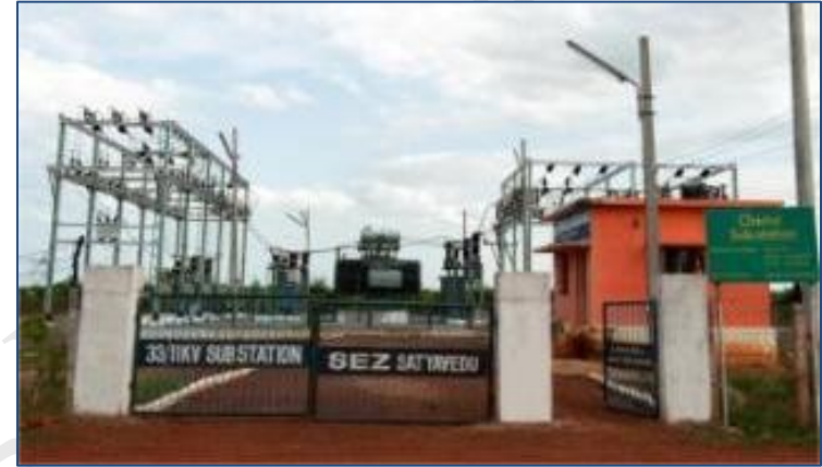
33 KV 分站