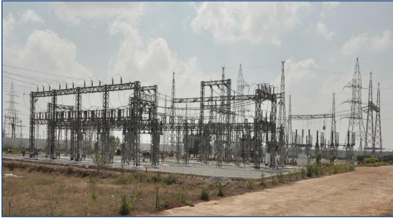
132 KV 分站