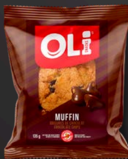
MUFFIN 6X135G BRISURES CHOCOLAT