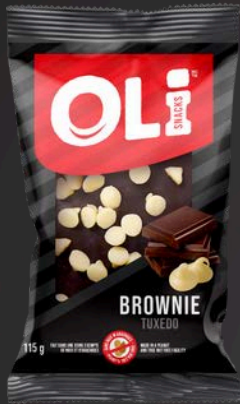
BROWNIE TUXEDO 12X115G