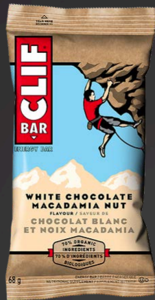
CHOCOLAT BLANC/ NOIX MACADAMIA 12X68G