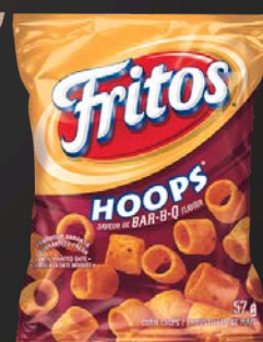
FRITOS HOOPS BBQ 40X57G