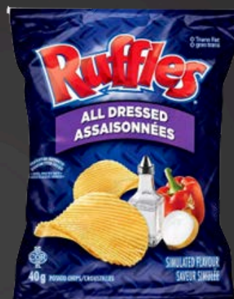
RUFFLES ASSAISONNÉES 48X40G