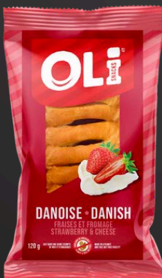
DANOISE 6X120G FRAISES/FROMAGE