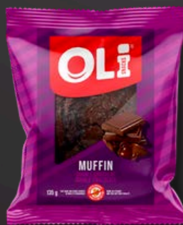
MUFFIN 6X135G DOUBLE CHOCOLAT