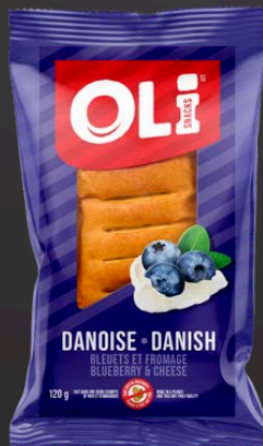
DANOISE 6X120G BLEUETS/FROMAGE