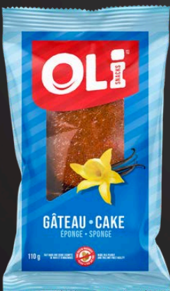
GÂTEAU 6X110G ÉPONGE