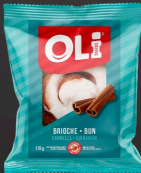
BRIOCHE 6X115G CANNELLE