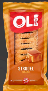
STRUDEL 6X120G CARAMEL