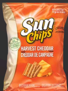
SUNCHIPS CHEDDAR CAMPAGNE 40X40G