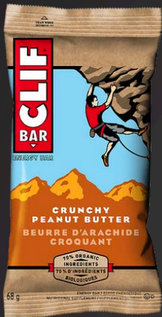
BEURRE D'ARACHIDE CROQUANT 12X68G