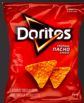
DORITOS FROMAGE NACHO 48X45G