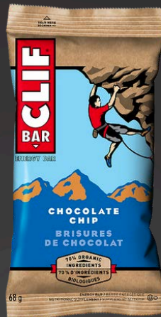
BRISURES CHOCOLAT 12X68G