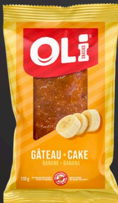
GÂTEAU 6X110G BANANE