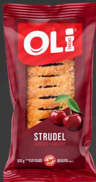
STRUDEL 6X120G CERISES