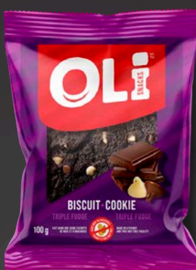
BISCUIT 8X100G TRIPLE FUDGE