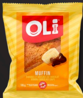
MUFFIN 6X135G BANANES/BRISURES CHOCOLAT