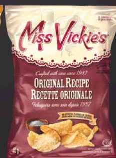
MISS VICKIE'S ORIGINAL 40X40G