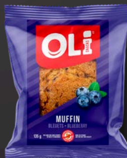
MUFFIN 6X135G BLEUETS