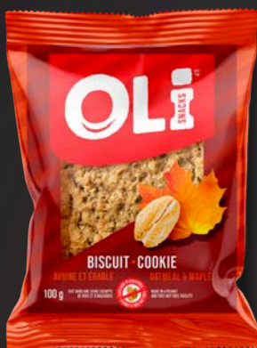
BISCUIT 8X100G AVOINE ÉRABLE