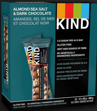
AMANDES/SEL DE MER/CHOCOLAT NOIR 12X40G