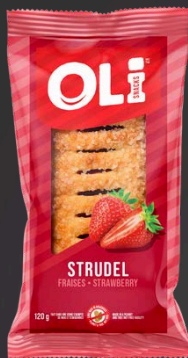
STRUDEL 6X120G FRAISES