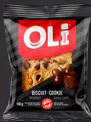
BISCUIT 8X100G BRISURES CHOCOLAT