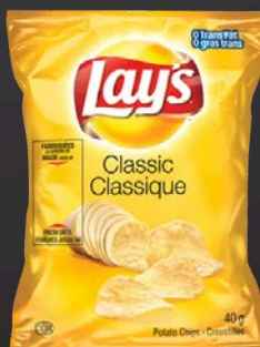
LAY'S CLASSIQUE 40X40G