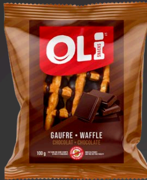
GAUFRE CHOCOLAT 12X100G