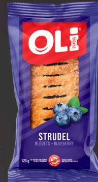
STRUDEL 6X120G BLEUETS