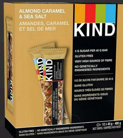
AMANDES/CARAMEL/ SEL DE MER 12X40G