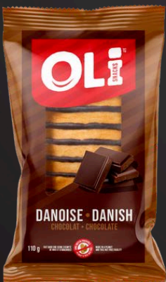
DANOISE 6X110G CHOCOLAT