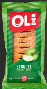
STRUDEL 6X120G POMMES