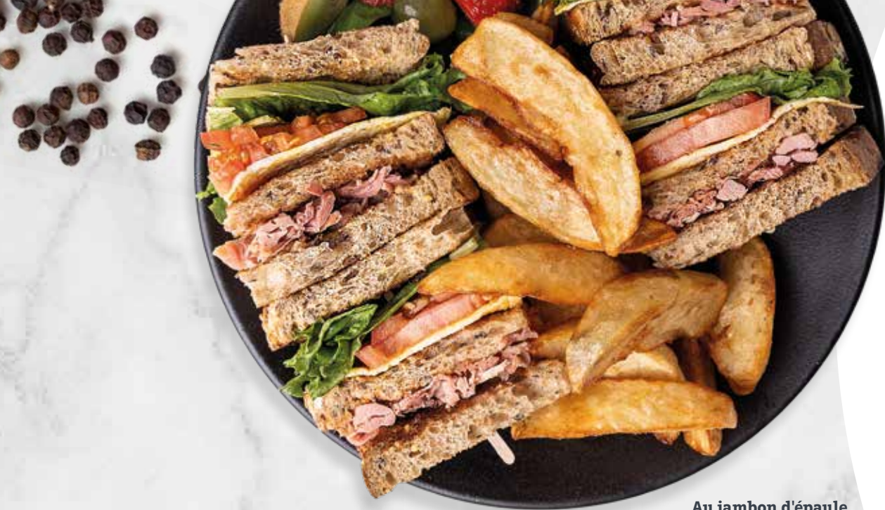
Au jambon d'épaule