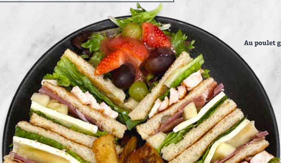
Au poulet grillé et prosciutto

Remplacez vos quartiers de pomme de terre rissolés par nos patates cajun au fromage cheddar (+3)