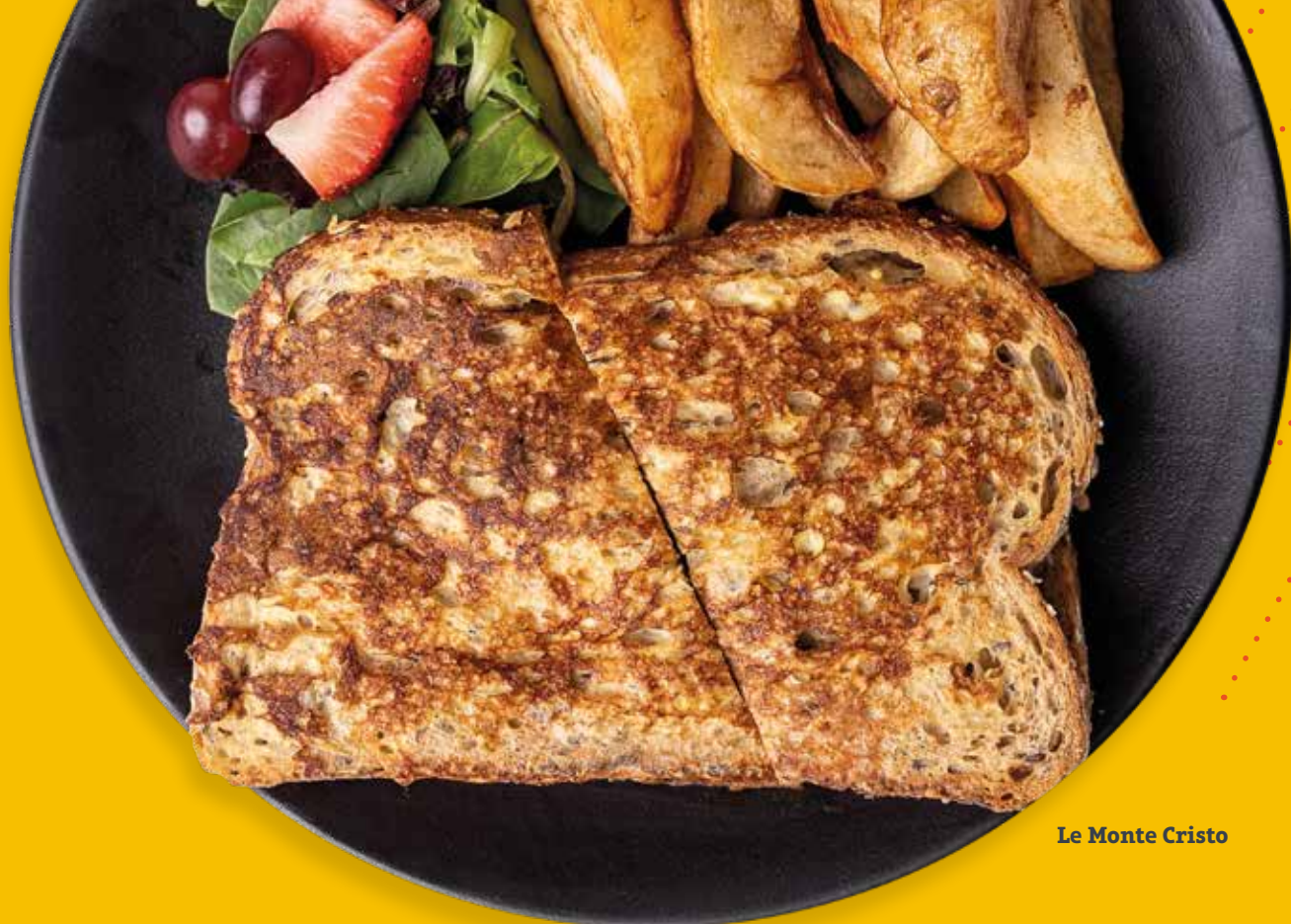
Le Monte Cristo