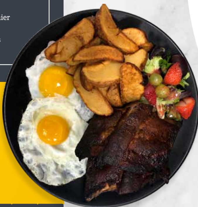
Le déjeuner du patron