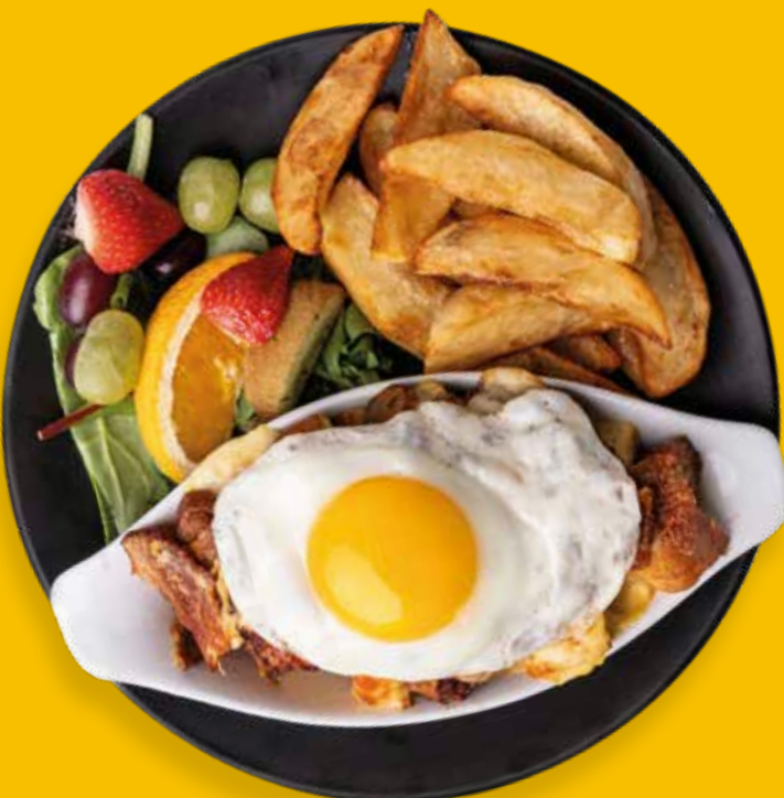
Aux saucisses à l'érable

Servis avec quartiers de pommes de terre rissolés, fruits, rôties et café.