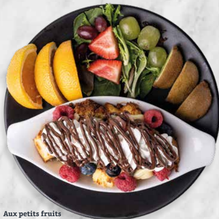
Aux petits fruits