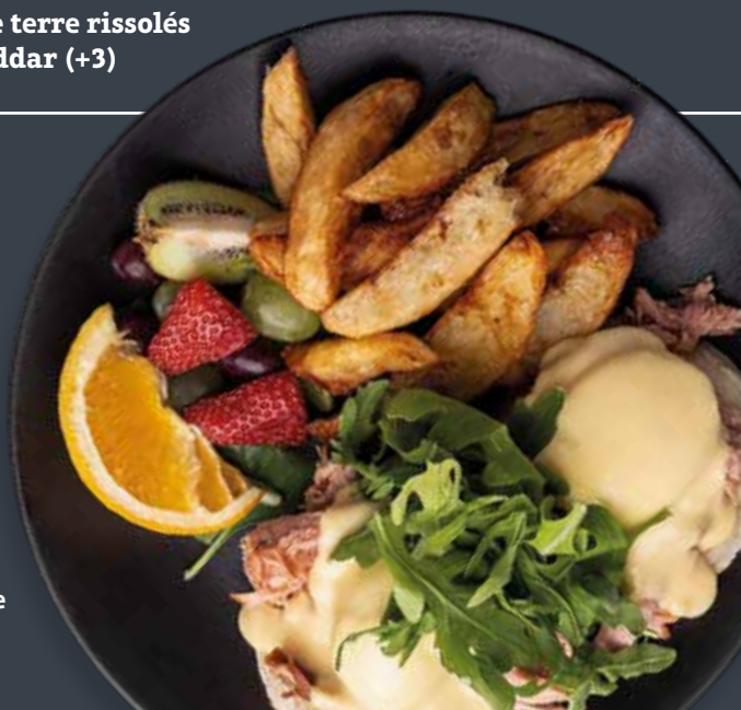
Au jambon d'épaule