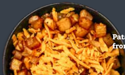
Patates cajun au fromage cheddar