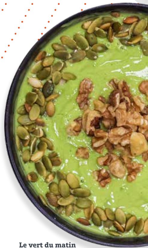
Le vert du matin

Pépites de chocolat au lait, M&M, brisures Skor, brisures Kit Kat, brisures Crunchie, brisures Caramilk, brisures Reese