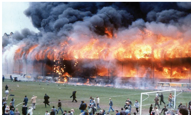
Incendio Estadio Bradford

empataba contra Lincoln City, dos equipos de la tercera división del fútbol inglés, basura que durante años se había colectado debajo de las graderías del estadio prendió fuego. Este incendio rápidamente enciende el techo de madera sobre estas graderías, como se puede ver en la foto anexa, y en cuestión de pocos minutos todo un costado del estadio estaba incendiado. Afortunadamente la mayoría de los espectadores pudieron evacuar hacia la grama, pero por la rapidez del incendio, 56 personas perdieron la vida y 265 más quedaron heridas.