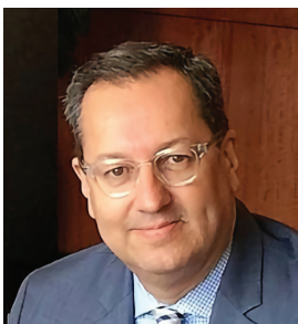
por JAIME A. MONCADA*

Esta clase de espacios requieren de una profunda evaluación de riesgos realizada por profesionales capacitados y experimentados.