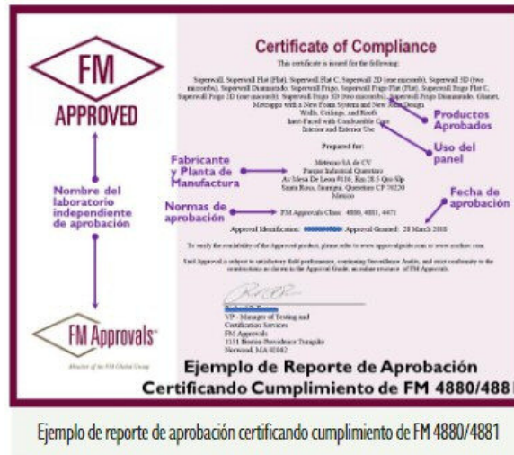
Ejemplo de reporte de aprobación certificando cumplimiento de FM 4880/4881

FM 4880 destaca una prueba más realista que la proporcionada por NFPA 285 9 . Además, debe tenerse en cuenta que, en algunos casos, las pruebas FM 4880 indican que algunos paneles fallarían, mientras que los mismos paneles probados siguiendo NFPA 285 pasarían; por lo tanto, se les otorgarían permisos de instalación sin restricciones en fachadas exteriores. Probablemente, el requerimiento de pruebas bajo FM 4880 aparecerá en la siguiente edición del IBC.