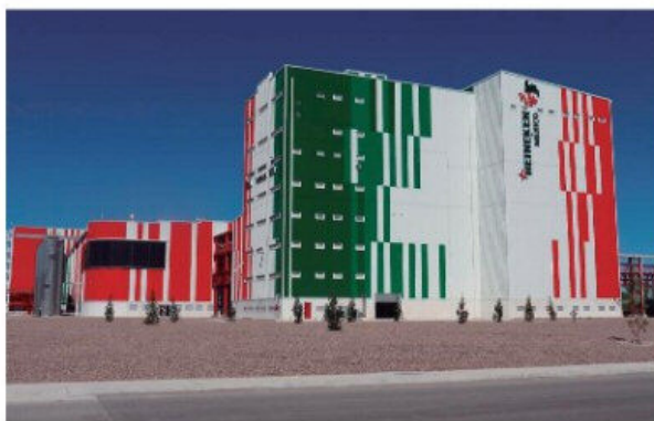
Fábrica de latas de cerveza de Heineken en Chihuahua, México con fachada de paneles MCM aprobados FM 4880/4881

A través del fabricante del panel debe obtenerse un certificado de FM Global que demuestre la certificación FM 4880/4881 para el panel específico, así como una indicación clara de que la certificación ocurrió en la planta donde se fabricó el panel. Dicho de otra forma, no es correcto pensar que todos los paneles metálicos tipo sándwich, por ejemplo con poliisocianurato (PIR), son riesgosos. Son riesgosos los que