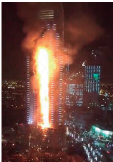
Incendio de la Torre The Address Downtown en el Año Nuevo del 2016.

Inclusive en el momento que escribo estas líneas, ocurrió un incendio en una torre de apartamentos de 36 pisos en Ajman, en los Emiratos Árabes Unidos (27 de junio de 2023), afectando 64 unidades residenciales 6 . A propósito, nuevos edificios en el Emirato de Dubai deben utilizar paneles certificados, pero esta regulación no es retroactiva a edificios existentes 7 .