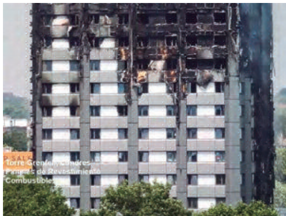
Fachada sur luego del incendio de la Torre Grenfell donde se aprecian los paneles de revestimiento exterior.

Sin embargo, se estima que en ese país existen unos 16 mil apartamentos con fachadas combustibles. Consecuentemente, el gobierno británico ha destinado aproximadamente 7 mil millones de dólares para eliminar estas fachadas, aunque se ha reportado que esta cantidad de dinero es insuficiente. La nueva legislación en el Reino Unido requiere también que para poder vender un apartamento que pudiera tener estos MCMs “no aprobados”, se debe haber remediado este problema reemplazándolos con paneles aprobados, lo cual ha creado un importante problema social en ese país 5 .