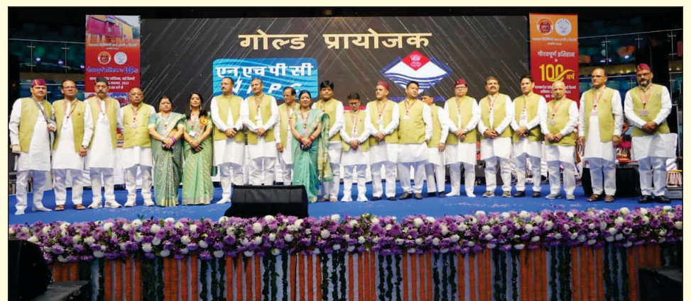
सभा की वर्तमान कार्यकारिणी