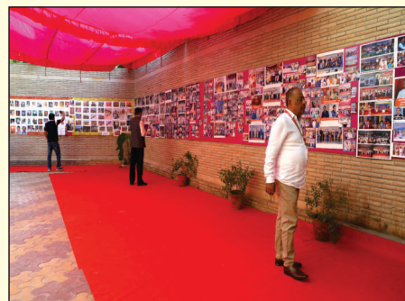
शताब्दी वर्ष चित्र प्रदर्शनी-2023