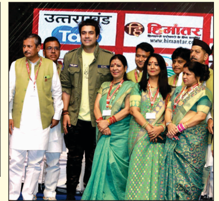
शताब्दी वर्ष विरासत 2023 में सुप्रसिद्ध गायक श्री जुबिन नौटियाल एवं कार्यकारिणी