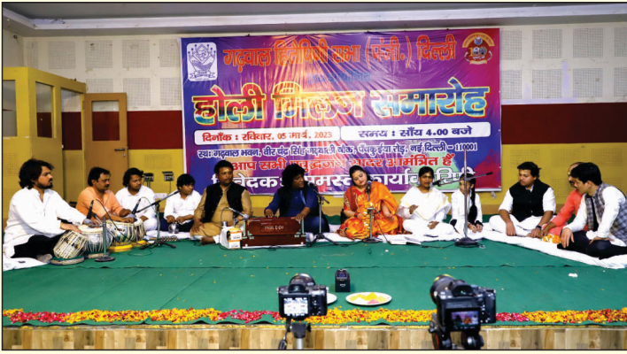
पारंपरिक होली मिलन समारोह-2023