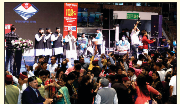
विरासत महोत्सव-2023 तालकटोरा स्टेडियम नई दिल्ली में गढ़रत्न श्री नरेंद्र सिंह नेगी द्वारा संगीतमय प्रस्तुति