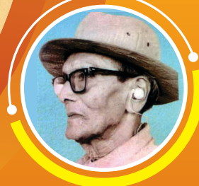
वीर चंद्र सिंह गढ़वाली