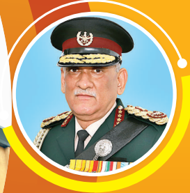
सीडीएस बिपिन रावत