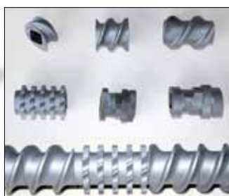
Ejemplo para husillo y elementos de husillo

Una característica especial es el barril de apertura fácil, que permite el acceso rápido a los husillos segmentados.