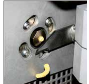
Proceso de corte