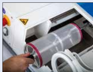
Facilita la retirada del tamiz redondo