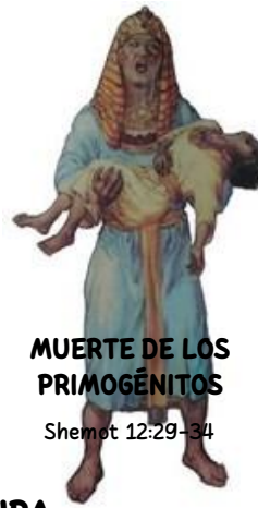
MUERTE DE LOS PRIMOGÉNITOS