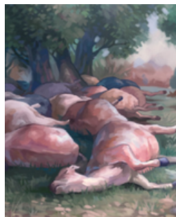
MUERTE DE GANADO