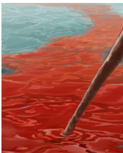
AGUA EN SANGRE