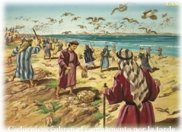
Codornices cubren el campamento por la tarde

16:13-14 “Y sucedió que por la tarde subieron las codornices y cubrieron el campamento, y por la mañana había una capa de rocío alrededor del campamento. Cuando la capa de rocío se evaporó, he aquí, sobre la superficie del desierto había una cosa delgada, como copos, menuda, como la escarcha sobre la tierra”. –