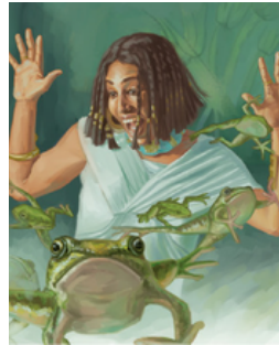
RANAS Shemot 8:1-15