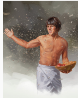
PIOJOS Shemot 8:16-19