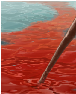
AGUA EN SANGRE Shemot 7:16-24