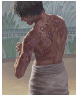
ULCERAS Shemot 9:8-16