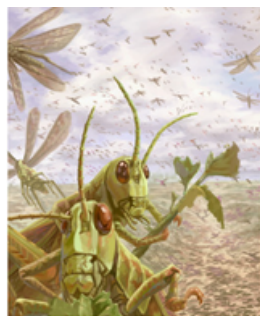
LANGOSTAS Shemot 10:1-19