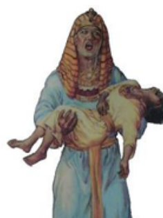
MUERTE DE LOS PRIMOGÉNITOS Shemot 12:29-34