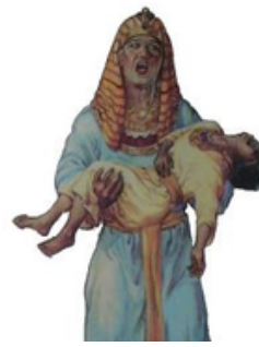
MUERTE DE LOS PRIMOGÉNITOS Shemot 12:29-34