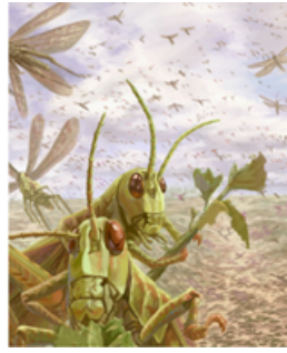
LANGOSTAS Shemot 10:1-19