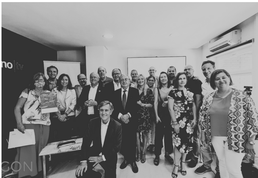
Foto de la Comunidad de la Fundación Ergon en la IV Jornada Anual

Y finalmente tuvieran un impacto real inmediato o en un plazo muy reducido .