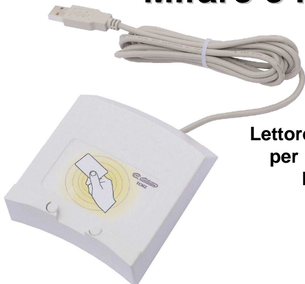
Lettores di identificazione per PC e apparecchi Multifunzioni