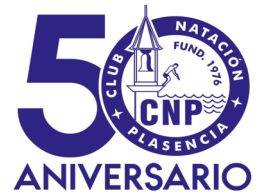
TABLA DE RECORDS TROFEO CIUDAD DE PLASENCIA