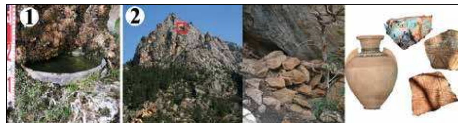
Fig.3: 1. Safa Puig Roig. 2. Localització refugi Morro d'en Joi, mur de condicionar l'espai i mostra material superficial.

L'anàlisi del jaciment del Corral Fals (Establiments), del puig de n'Escuder (Caimari) i la fortificació dels Pinetons (Escorca) va permetre agafar com a referència el sistema constructiu d'aquests elements arquitectònics i comparar-los amb altres localitzats en altres punts de la Serra. Aquests tres primers casos tenien un element en comú formidable... Tots ells eren indrets datables a partir de les restes ceràmiques, exclusivament de cronologia almohade. La possibilitat de relacionar aquesta tipologia arquitectònica amb restes materials d'un moment cultural en concret feren factible relacionar-les amb altres construccions localitzades. Aquestes presentaven una total absència de material ceràmic que les permetés datar però amb unes característiques tècniques molt similars: poc acurada i d'execució ràpida i precipitada, a més de presentar accessos