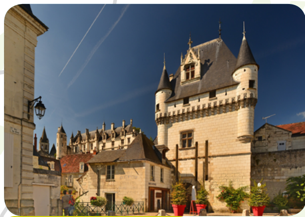
Cité royale de Loches