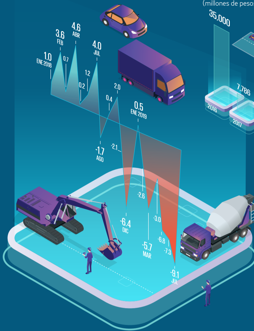
GRÁFICO: ARTURO RAMÍREZ Fuente: SHCP e Inegi.