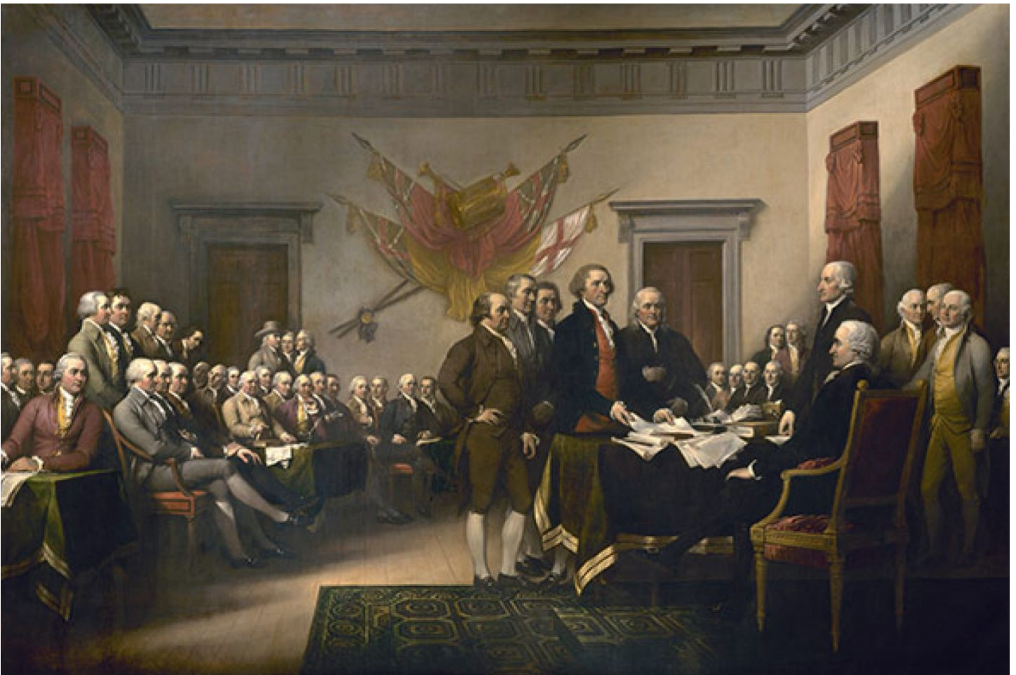
Declaración de la independencia. Arquitecto del Capitolio (aoc.gov)

Pero ni la firma de la Declaración ni la fundación de los Estados Unidos sucedieron como se muestra la pintura.