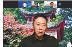
中文教師學會的積極支援，新澤西Ronghua Group LLC榮華保險公司提供贊助。