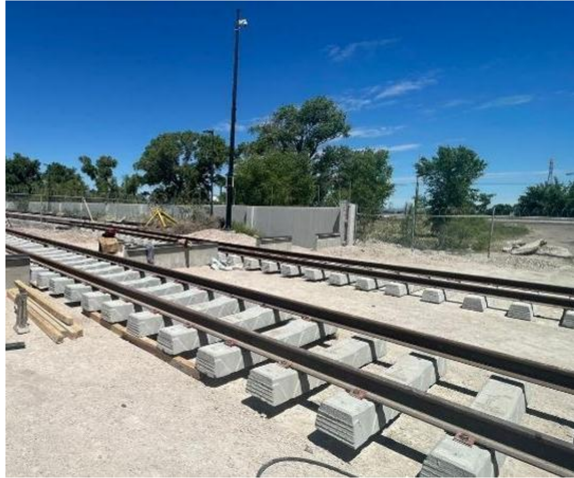
Vías de ferrocarril