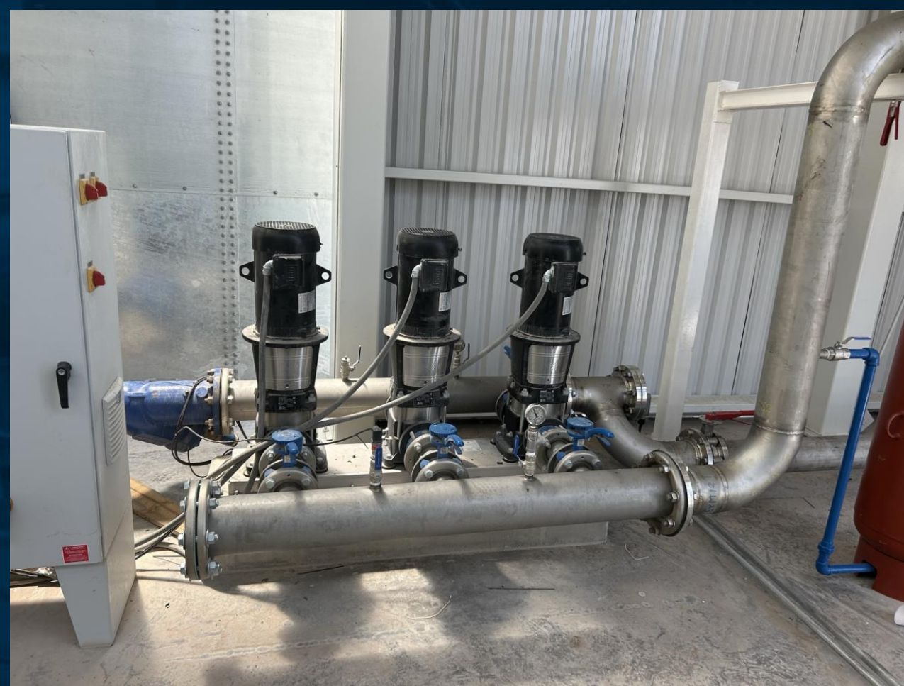
Sistema de bombas triplex