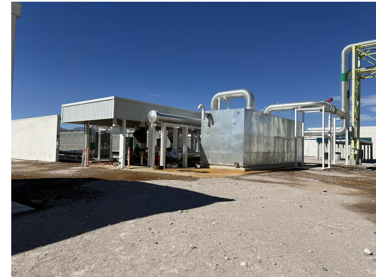
Sistema de agua helada