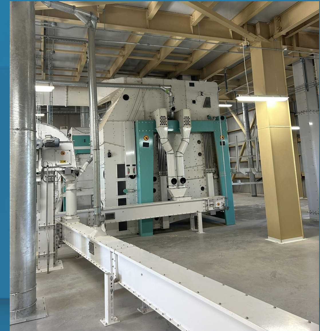
Puesta en marcha (commissioning)