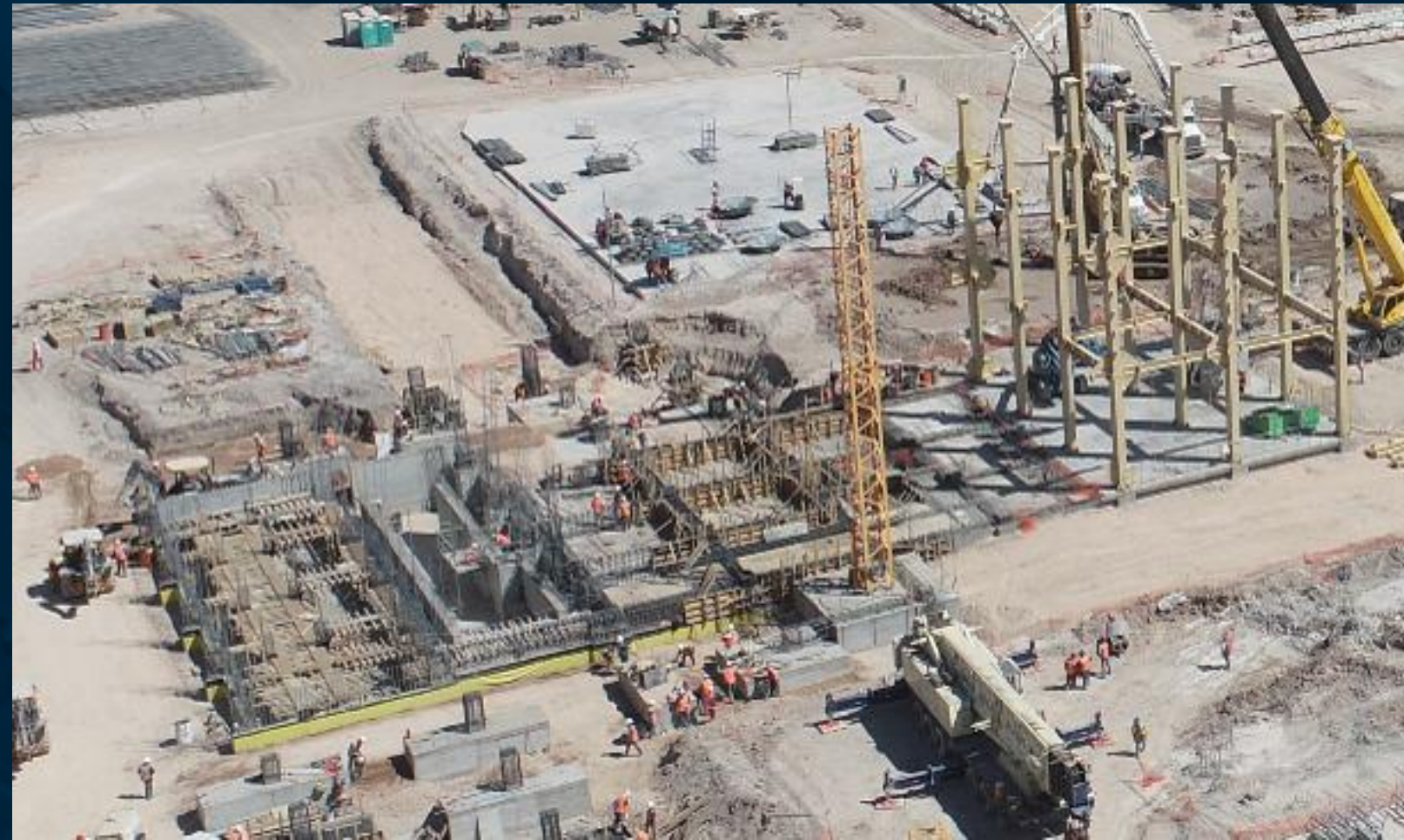
Cimentación y Estructura