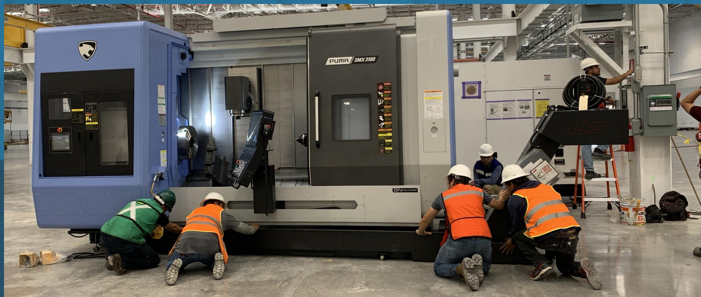
Instalación y pruebas