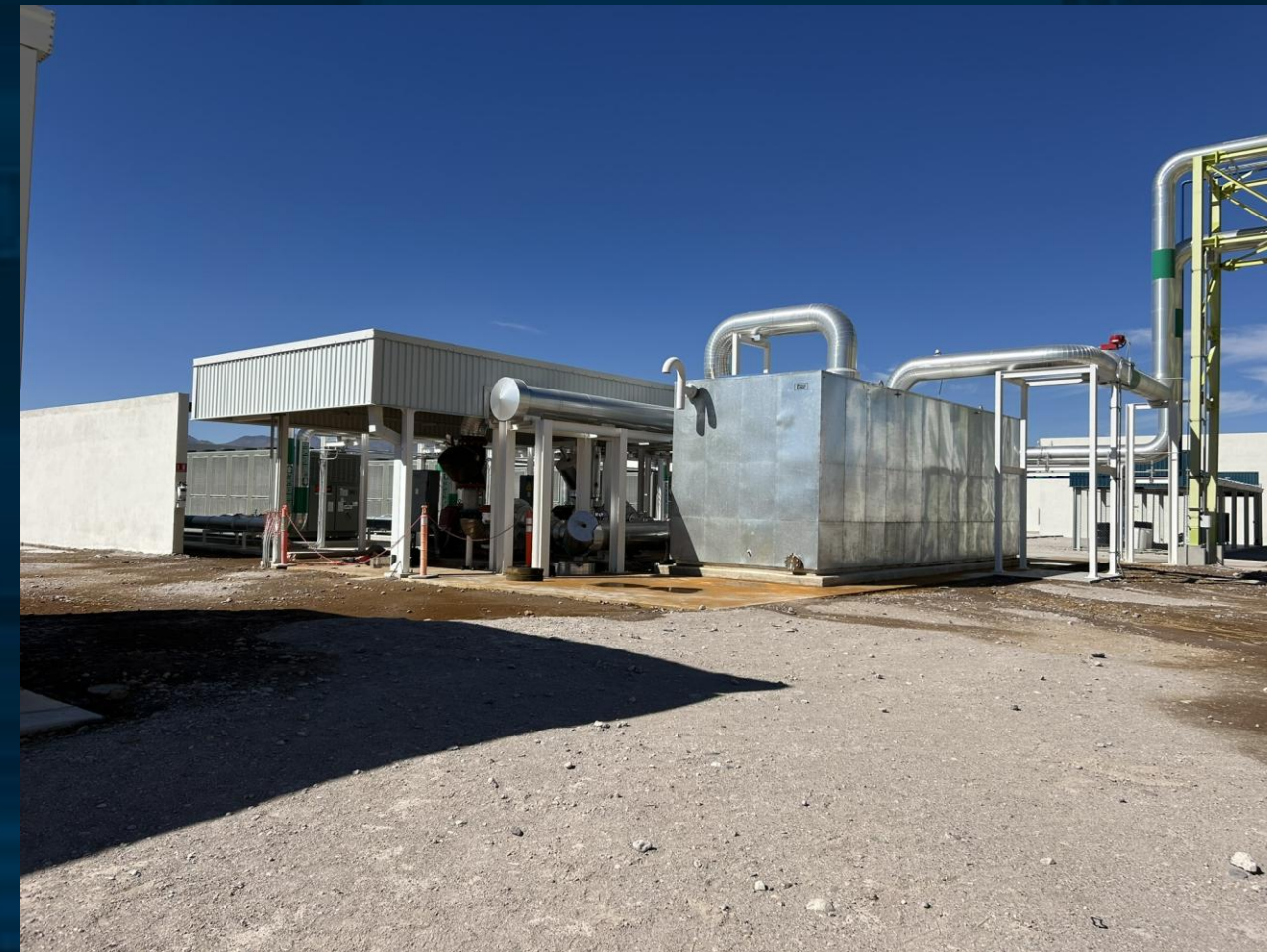
Sistema de agua helada