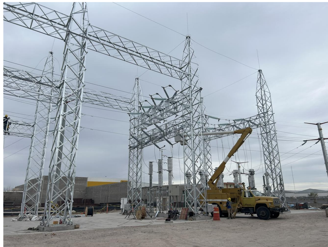
Subestación eléctrica 115,000 V