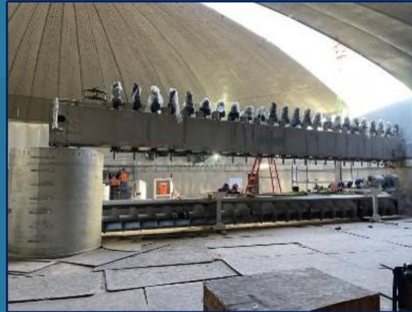
Ensamble de equipos