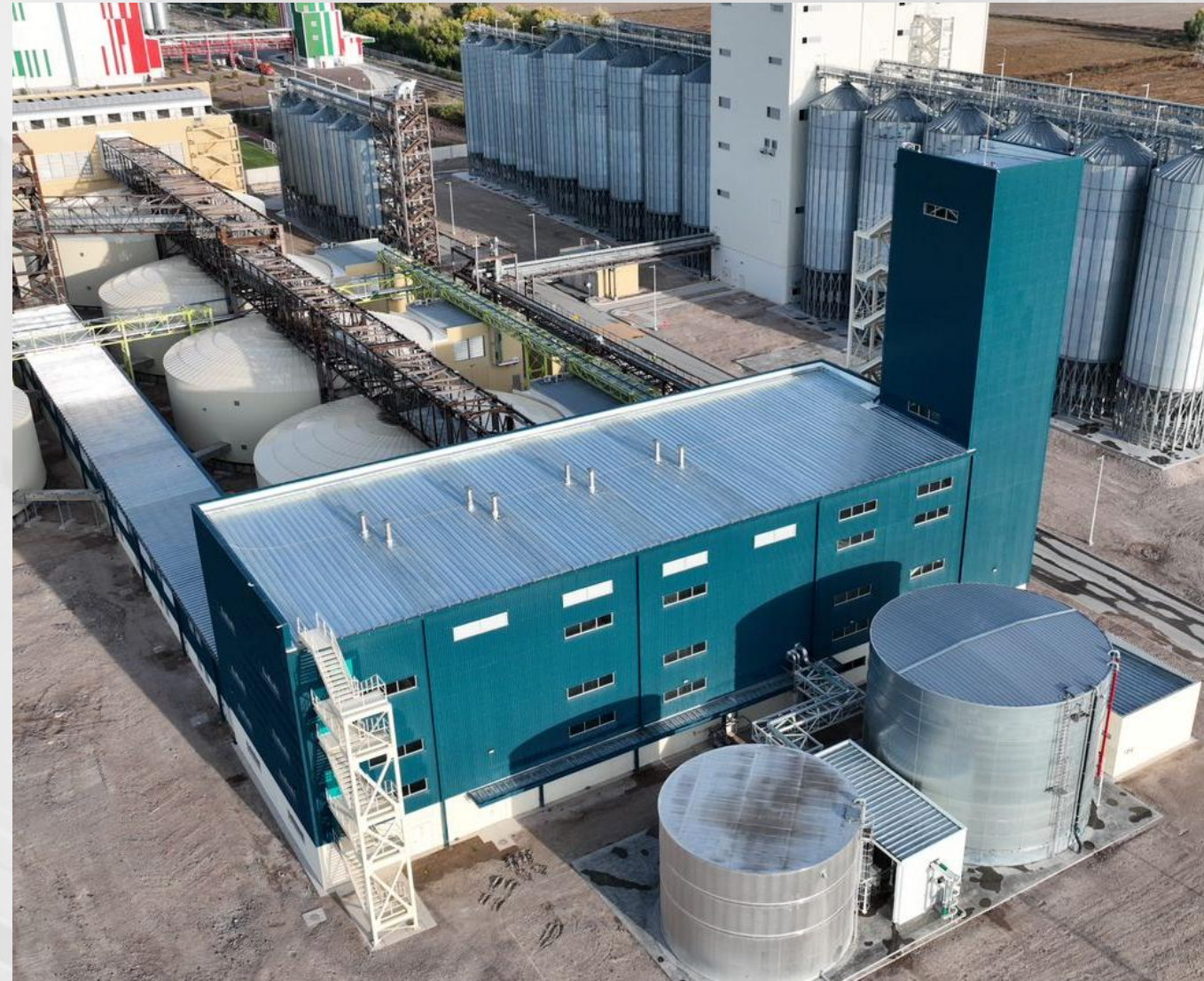
Estructura metálica y lámina