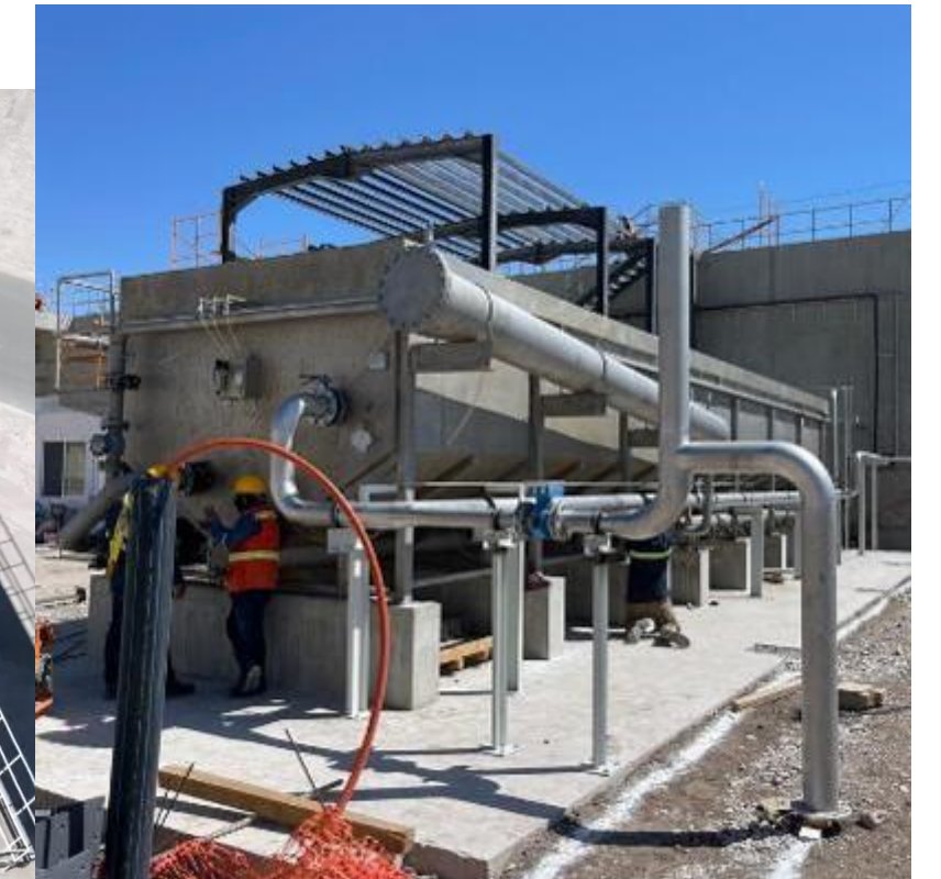
Planta de tratamiento de agua