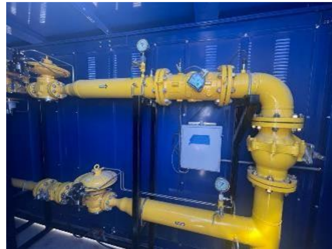
Caseta de descompresión de gas natural