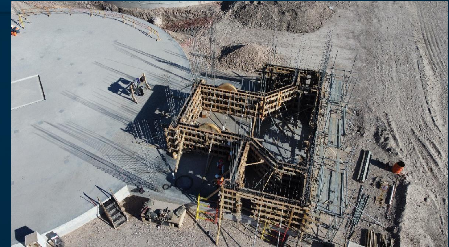
Muros de concreto