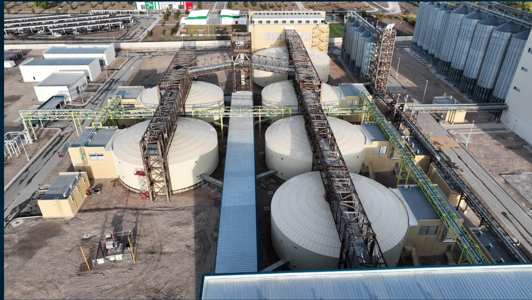
Equipos de germinación de grano