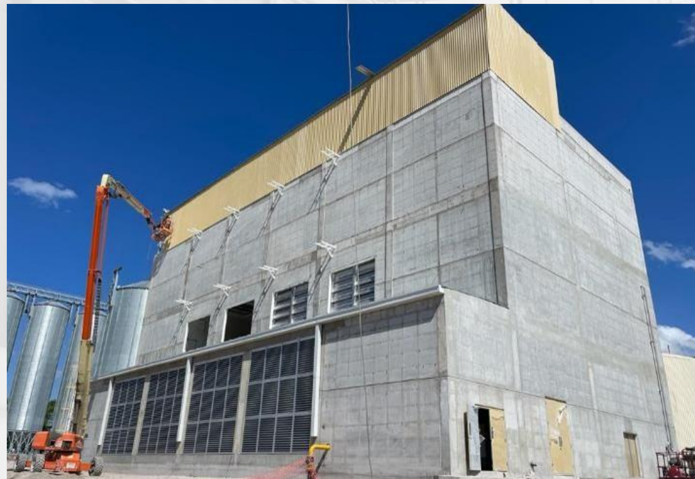
Edificio de concreto