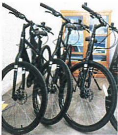
Vélos TREK de POLO VÉLO