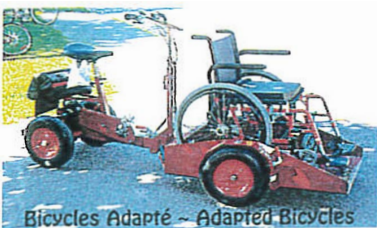
Vélo communautaire adapté pour personnes à mobilité réduite Avec la participation financière de la Ville de Gatineau