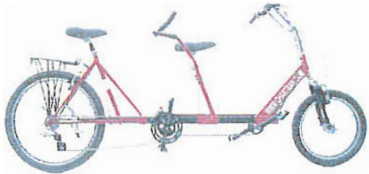
Vélo Tandem pour personnes malvoyantes ou aveugles Avec la participation financière de la Ville de Gatineau