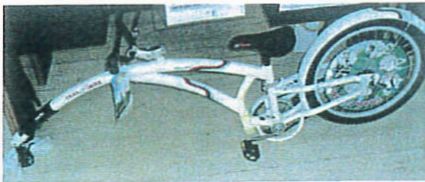
Tandem pour enfant Don de Pecco's