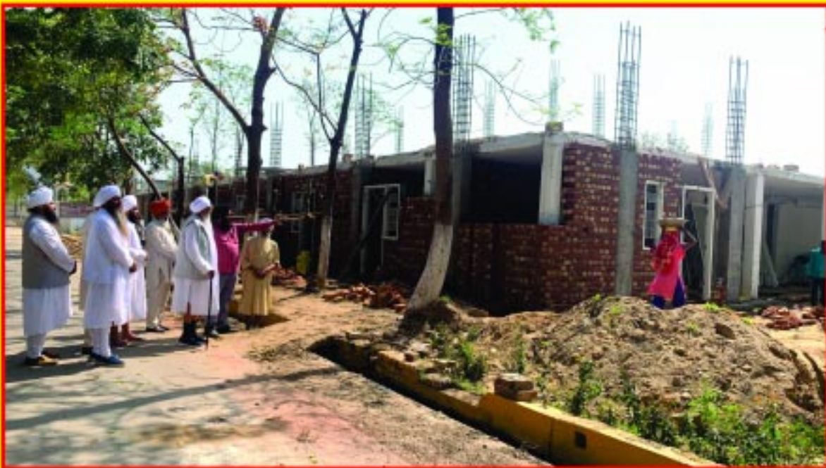
ਰਤਵਾੜਾ ਸਾਹਿਬ ਵਿਖੇ ਉਸਾਰੀ ਅਧੀਨ - ਰਿਹਾਇਸ਼ੀ ਇਮਾਰਤ