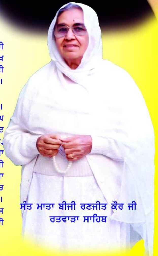
ਸੰਤ ਮਾਤਾ ਬੀਜੀ ਰਣਜੀਤ ਕੌਰ ਜੀ ਰਤਵਾੜਾ ਸਾਹਿਬ