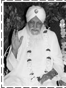
ਸੱਚਖੰਡ ਵਾਸੀ ਸ੍ਰੀ ਮਾਨ