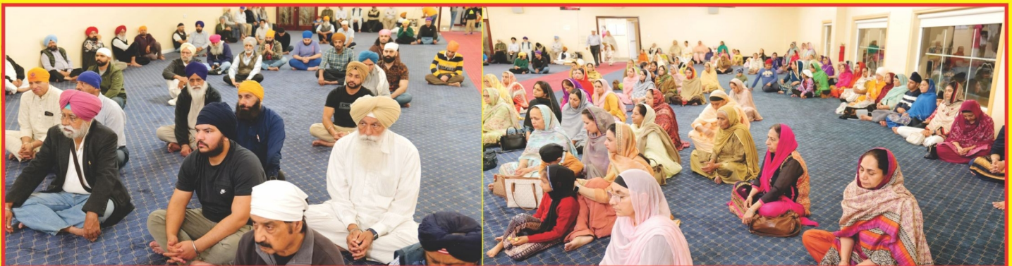
ਗੁਰਦੁਆਰਾ ਬਿਉਨਾ ਪਾਰਕ (ਲਾਸ ਐਂਜਲਸ, ਅਮਰੀਕਾ)