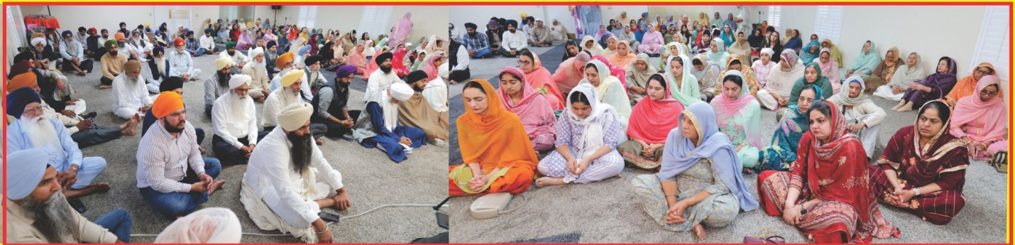
ਗੁਰਦੁਆਰਾ ਗੁਰੂ ਦਸਮੇਸ਼ ਦਰਬਾਰ ਬੇਕਰਸਫੀਲਡ