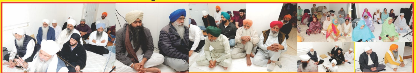
ਮਿਸ਼ਨ ਦੇ ਨਵੇਂ ਬਣੇ ਅਸਥਾਨ 'ਸਤਨਾਮ ਕੁਟੀਆ' ਬੇਕਰਸਫੀਲਡ ਵਿਖੇ