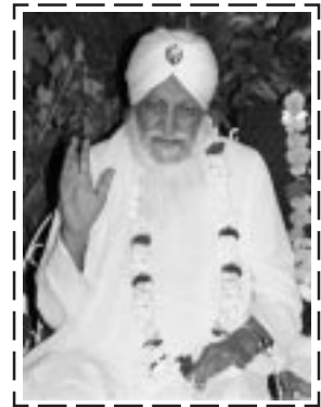
ਸੱਚਖੰਡ ਵਾਸੀ ਸ੍ਰੀ ਮਾਨ