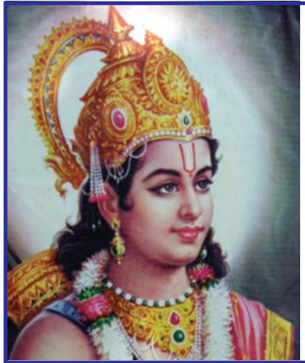
ਸ੍ਰੀ ਰਾਮ ਚੰਦਰ ਜੀ

ਫਿਰ ਕਹਿਣ ਲੱਗੇ ਕਿ ਉਨ੍ਹਾਂ ਨੇ ਧਰਮ ਦਾ ਸਾਕਾ ਕੀਤਾ, ਸੀਸ ਦੇ ਦਿਤਾ ਪਰ ਆਪਣੇ ਇਰਾਦੇ ਉਤੇ ਦ੍ਰਿੜ੍ਹ ਰਹੇ। ਇਸੇ ਤਰ੍ਹਾਂ ਨਾਲ ਆਪਾਂ ਵੀ ਸੰਸਾਰ ਵਿਚ ਦ੍ਰਿੜ੍ਹਤਾ ਨਾਲ ਇਹ ਸਾਕਾ ਕਰੀਏ। ਆਪਣਾ ਜੋ ਵੰਸ਼ ਹੈ ਸ੍ਰੀ ਰਾਮ ਚੰਦਰ ਜੀ ਮਹਾਰਾਜ ਅਤੇ ਮਾਤਾ ਸੀਤਾ ਜੀ ਦੀ ਪ੍ਰਮ ਪਵਿੱਤਰਤਾ ਤੋਂ ਚਲਿਆ ਆ ਰਿਹਾ ਹੈ, ਬੇਦੀ ਕੁਲ ਅਤੇ ਸੌਢੀ ਵੰਸ਼ ਉਸ ਮਹਾਨ ਪਵਿੱਤਰ ਬੰਸ ਦੀਆਂ ਸ਼ਾਖਾਂ ਹਨ। ਜਿਵੇਂ ਦਰਖਤ ਦੀ ਜੜ੍ਹ ਧਰਤੀ ਵਿਚ ਰਹਿ ਜਾਂਦੀ ਹੈ, ਪਰ ਉਸ ਦੇ ਟਾਹਣੇ ਪੱਤੇ, ਫਲ, ਫੁਲ, ਬਾਹਰ ਨਜ਼ਰ ਆਉਂਦੇ ਹਨ ਸੋ ਆਪਣੇ ਗੌਰਵ ਨੂੰ ਪਹਿਚਾਣੀਏ ਅਤੇ ਸਾਬਤ ਨਿਸ਼ਚੇ ਸਹਿਤ ਸ਼ਹੀਦੀ ਦੇ ਦੇਈਏ। ਭਾਈ ਸੰਤੋਖ ਸਿੰਘ ਜੀ ਨੇ ਲਿਖਿਆ ਹੈ-