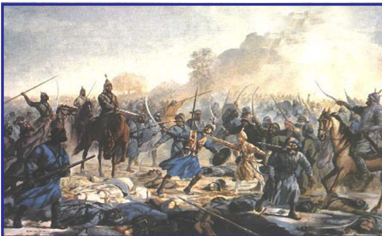
ਸਾਹਿਬਜ਼ਾਦਾ ਜੁਝਾਰ ਸਿੰਘ ਜੀ ਜੰਗ ਦੇ ਮੈਦਾਨ ਵਿਚ ਜੋਹਰ ਦਿਖਾ ਰਹੇ ਹਨ।