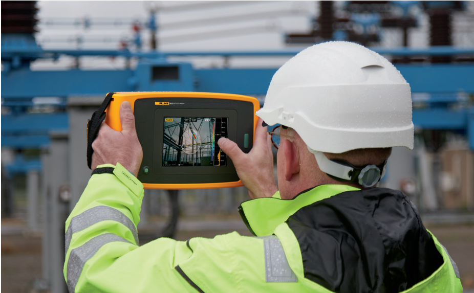
Imagen tomada de la cámara acústica de precisión ii910, que detecta descarga parcial en una aplicación de alta tensión.