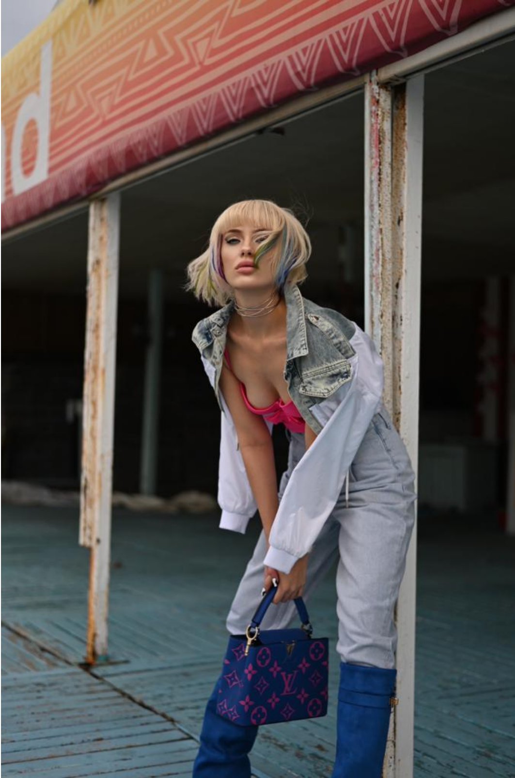
Müziksiz yaşayamayanlardanım diyebilirim