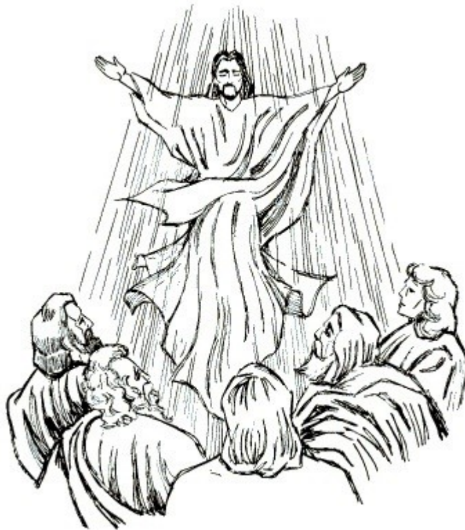
Иисус поднимается на небо