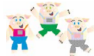
Ilustração: Joseane A. Ferreira / freepik