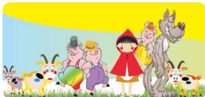
Ilustração: Joseane A. Ferreira / freepik

2. QUAIS SÃO SUAS HISTÓRIAS PREFERIDAS COM LOBOS? ESCOLHA DUAS HISTÓRIAS COM LOBOS QUE VOCÊ MAIS GOSTA. ESCREVA OS TÍTULOS A SEGUIR: